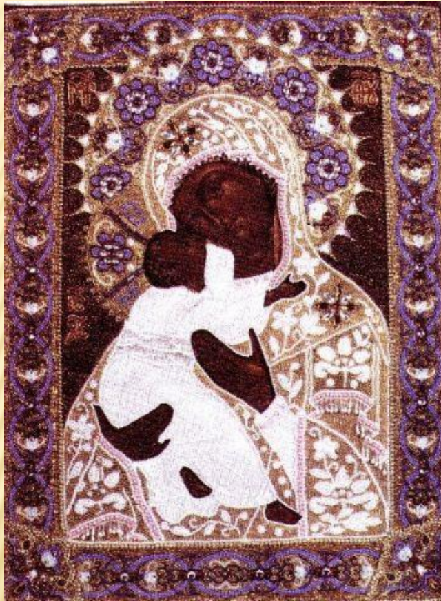
Икона. Вышивка бисером. 1800 год, Россия