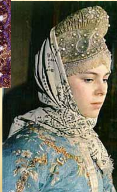
Женский головной убор. Вышивка бисером и жемчугом. 1700 год, Россия