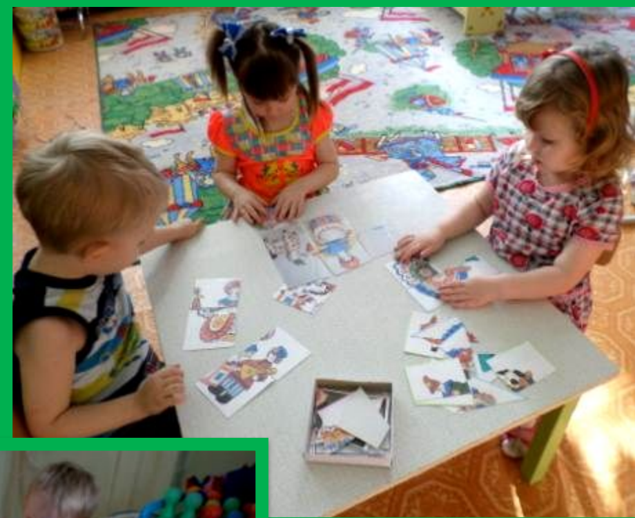
Настольная игра разрезные картинки «Собери Дымку»