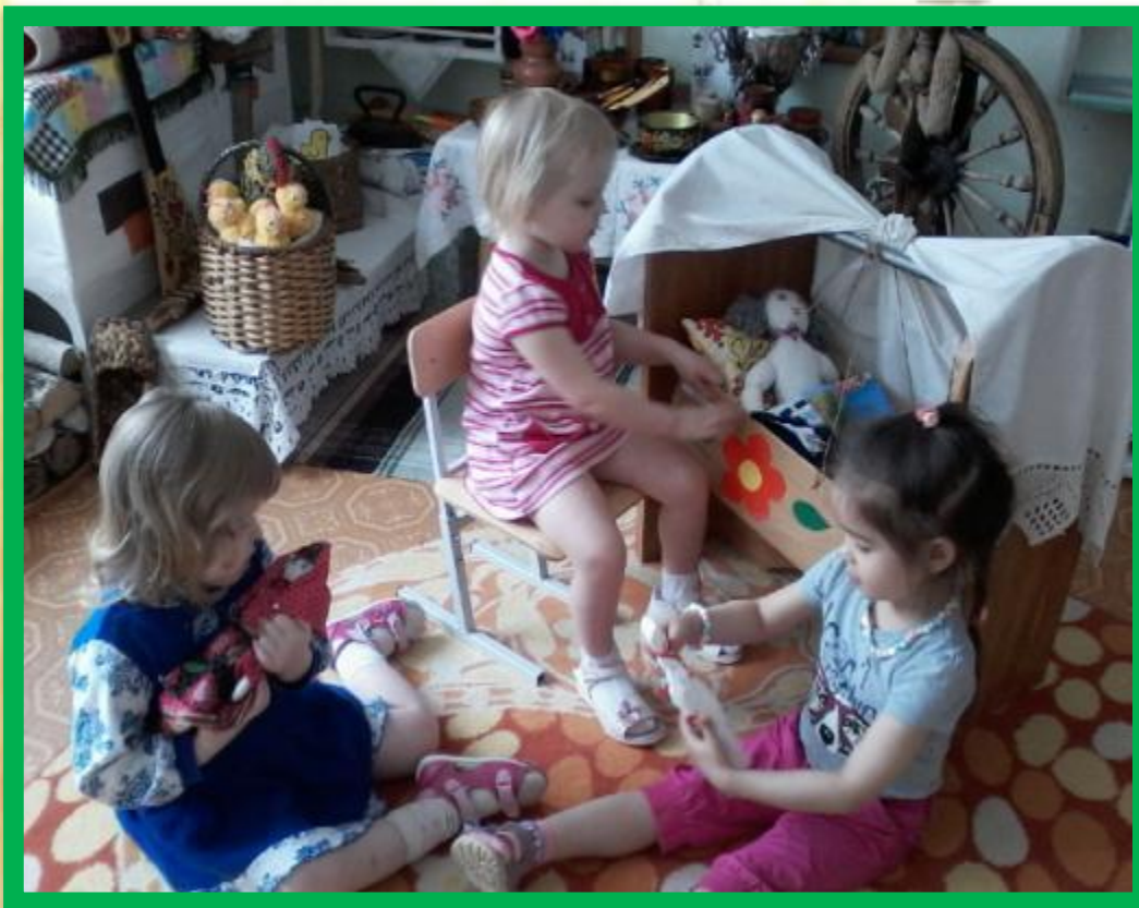
«Самостоятельная игровая деятельность»