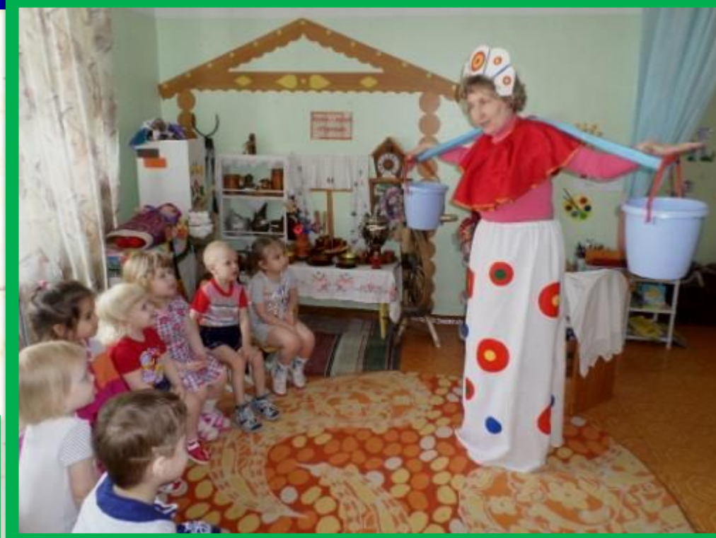
Экскурсия «Знакомство с барышней «Водоноска»