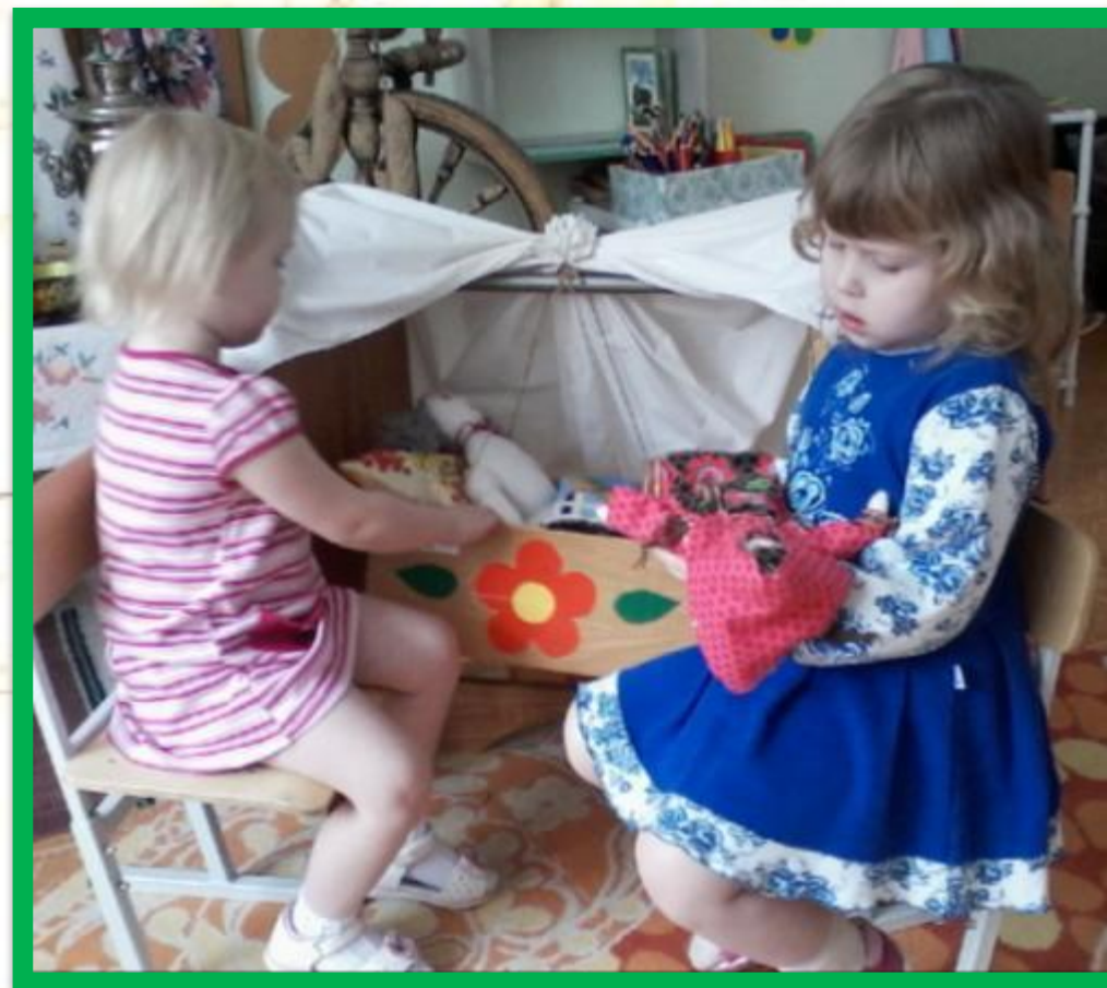
Сюжетно ролевая игра «Дочки – матери»