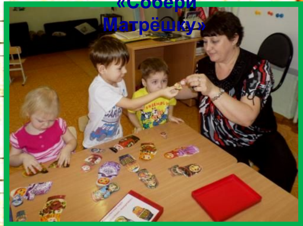
Дидактическая игра «Собери Матрёшку»