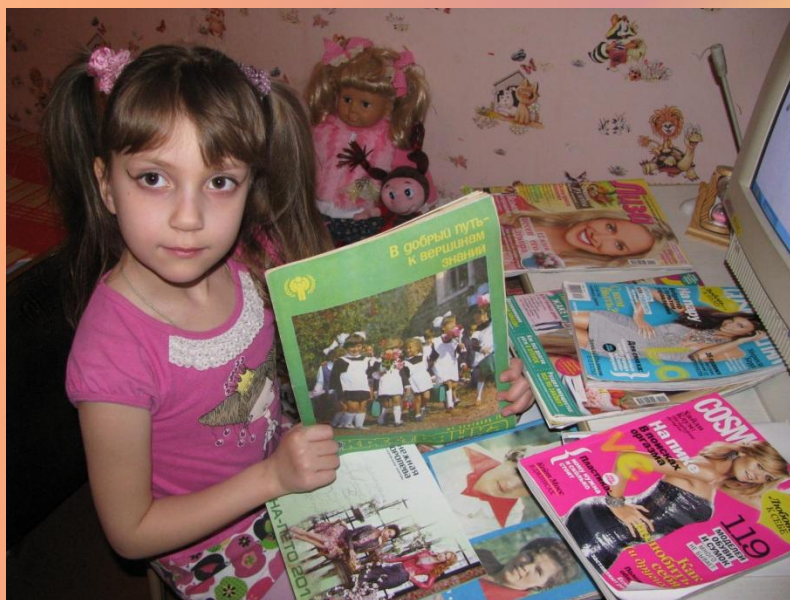
Конкурс "Детский исследовательский проект"