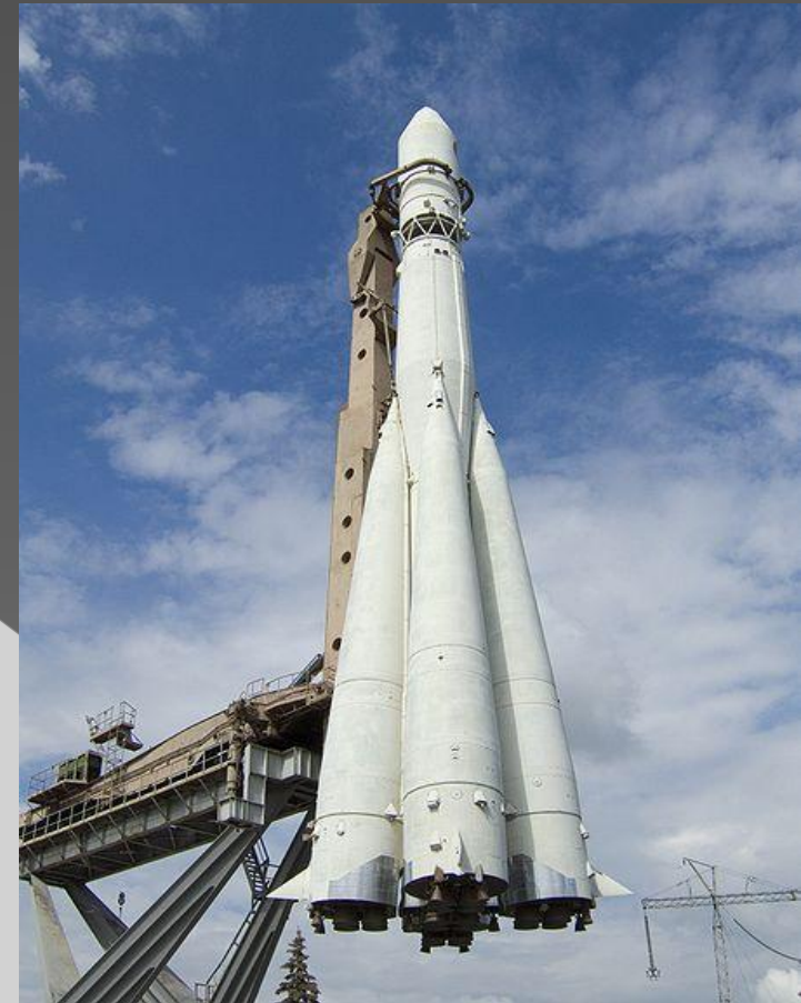
Макет ракеты-носителя “Восток” в Москве

Восток — наименование серии советских космических кораблей, предназначенных для полётов по околоземной орбите. Создавались под руководством генерального конструктора Сергея Павловича Королёва с 1958 по 1963 год.