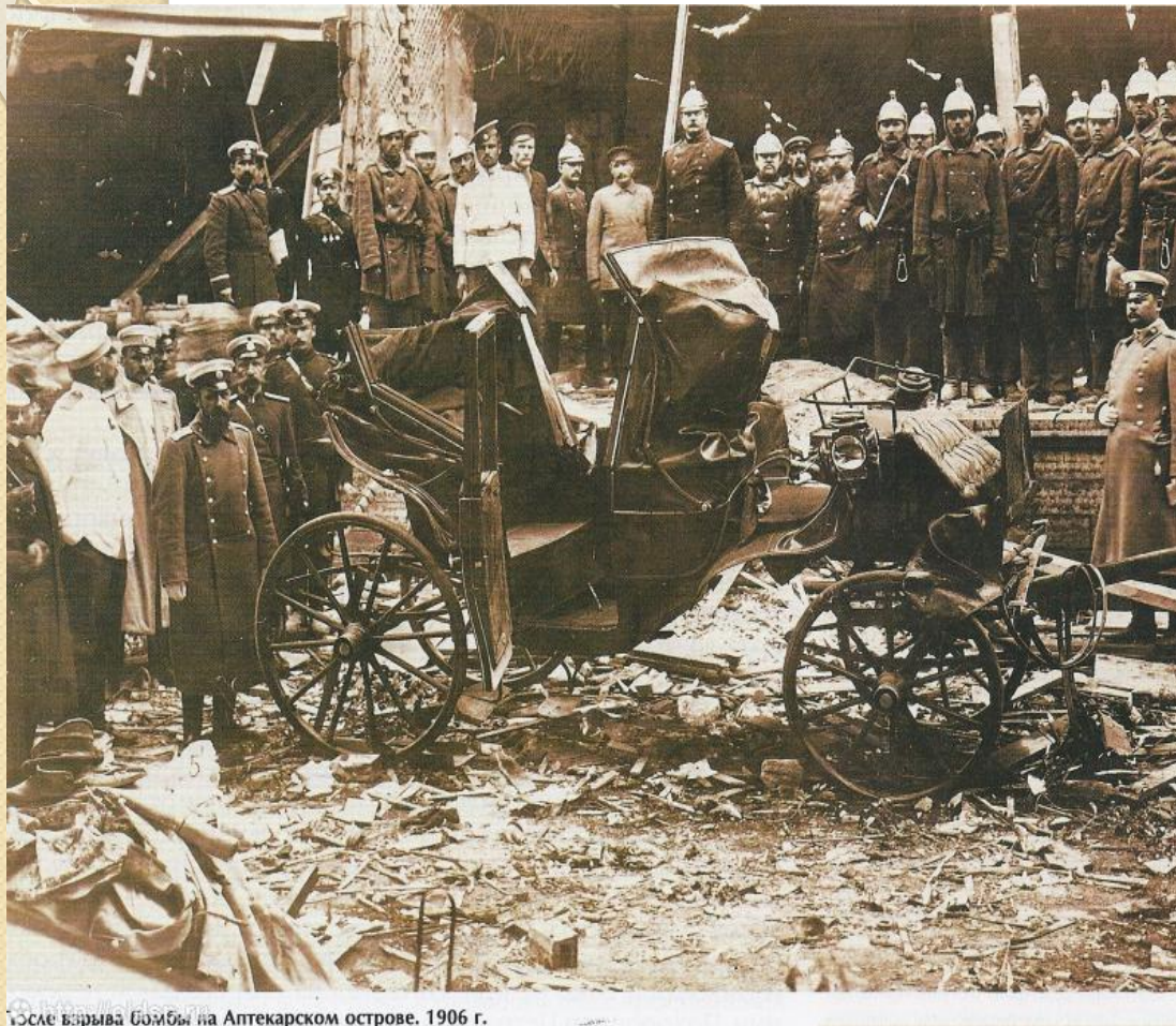
После взрыва бомбы на Аптекарском острове, 1906 г.

Положения 19 февраля 1861 г. (Общее положение о крестьянах, Положение о выкупе I и др.) декларировали отмену крепостной зависимости, установили право крестьян на земельный надел и порядок осуществления выкупных платежей за него. По этому законодательству земля была крестьянам выделена, но использование земельных участков существенно ограничивалось обязательствами перед бывшими собственниками по их выкупу.