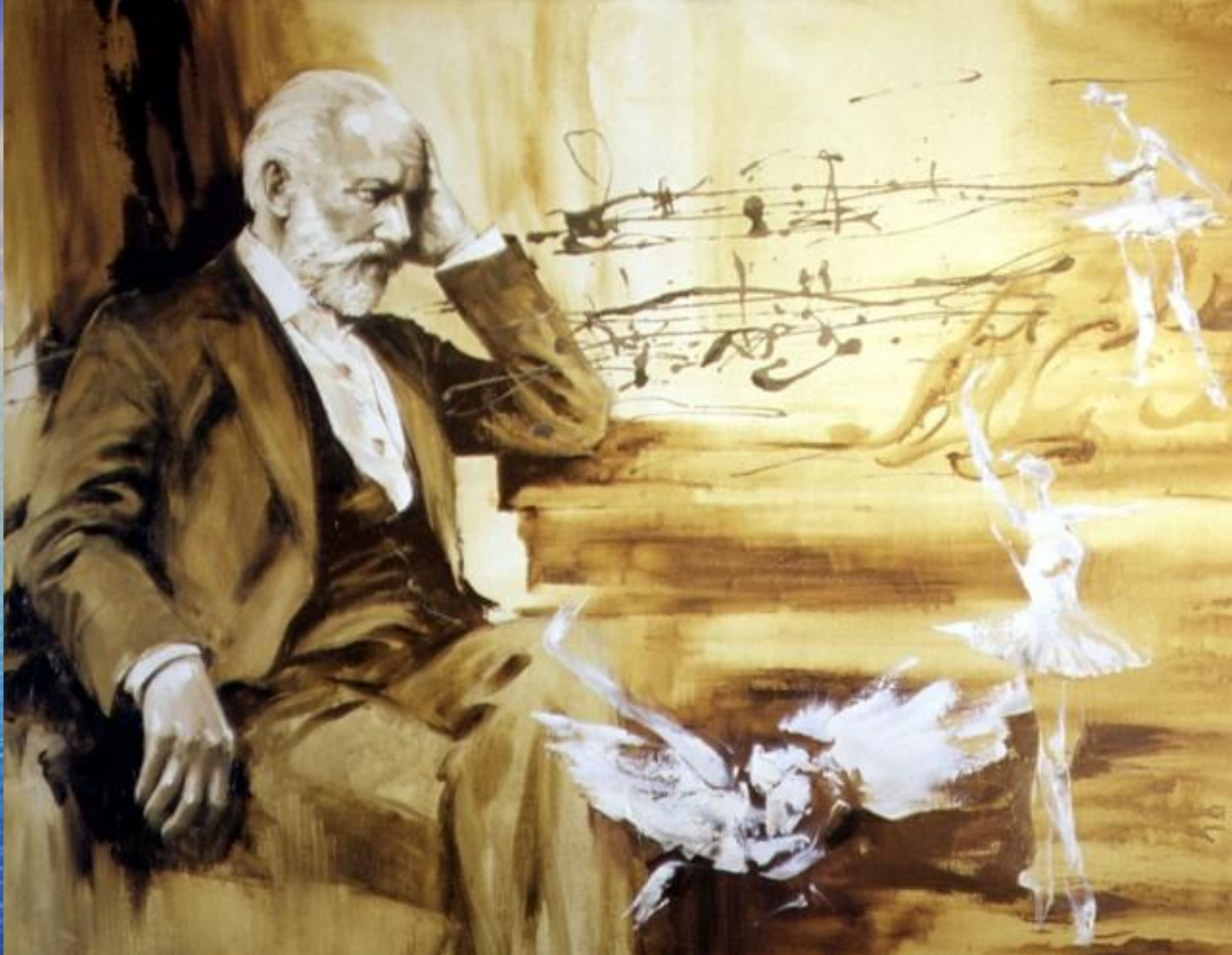
Петр Ильич Чайковский