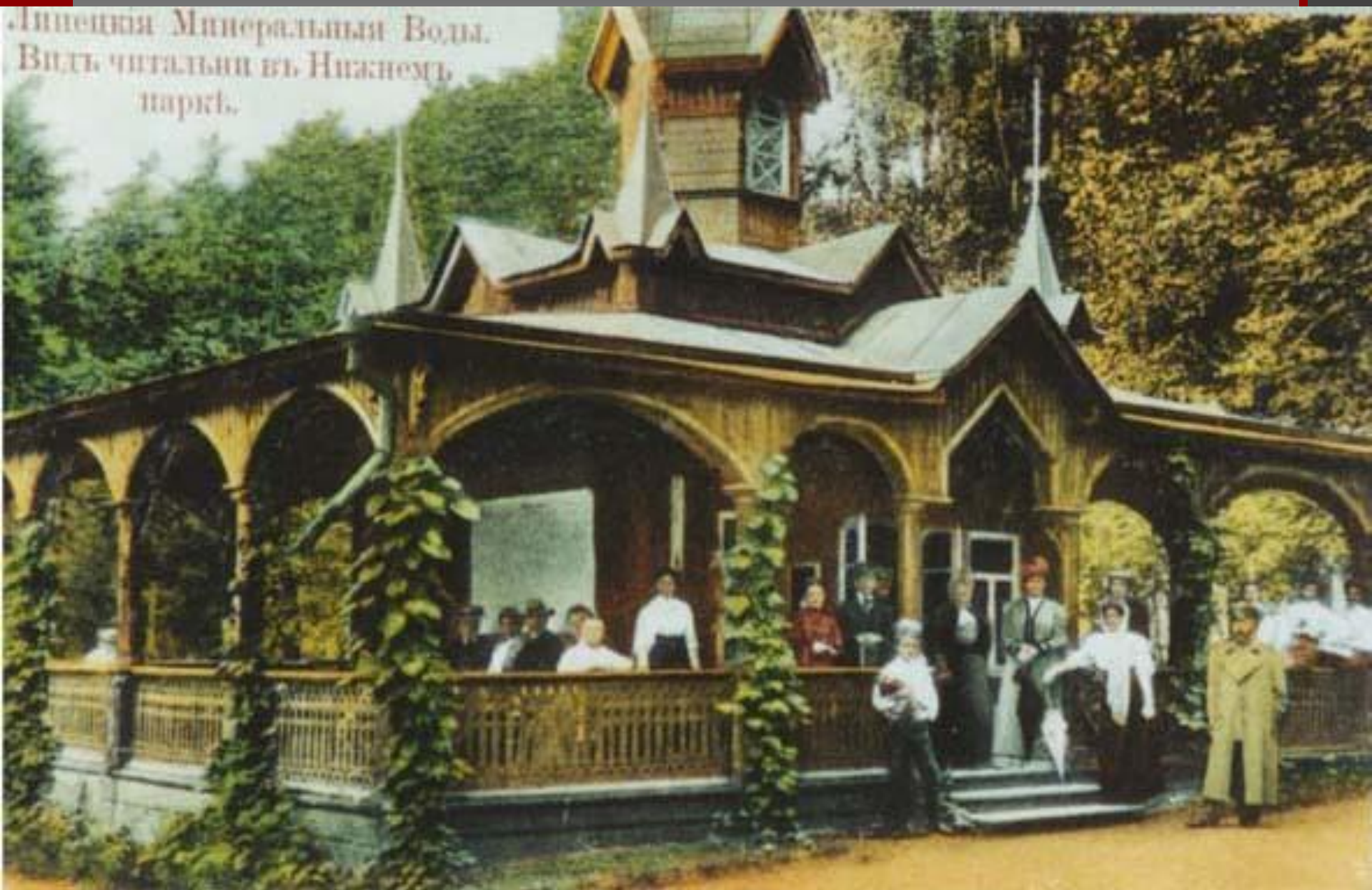
Липецкая Минеральная Вода. Виды читальни въ Нижнемъ парке.