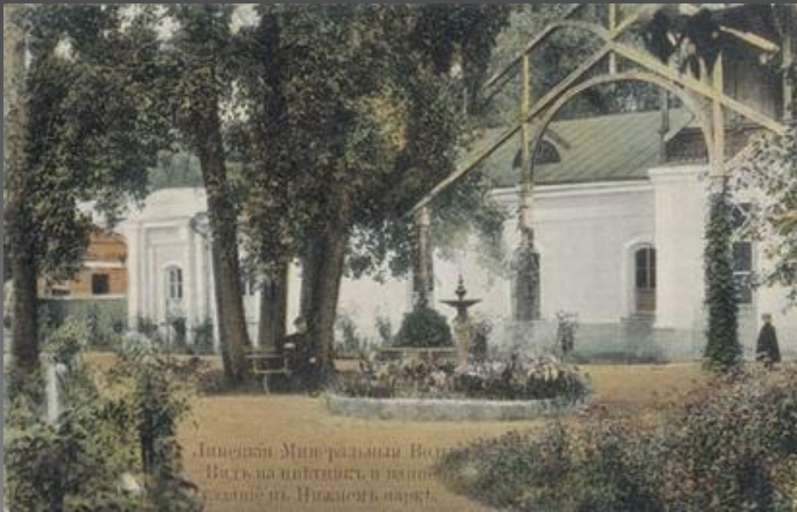
Линейный Минеральный Водопровод Вид на питьевой павильон в саду в Нижнем парке.