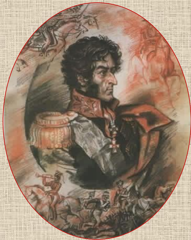
Пётр Иванович Багратион 1765 - 1812