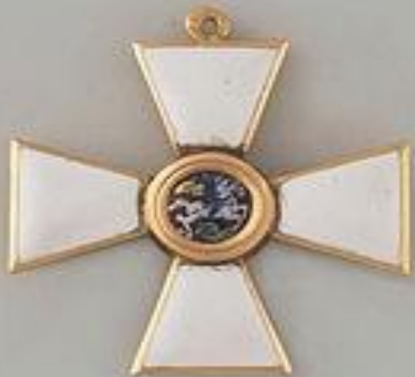
Знак 4-й степени

«Ни высокая порода, ни полученные пред неприятелем раны, не дают право быть пожалованным сим орденом: но дается оный тем, кои не только должность свою исправляли во всем по присяге, чести и долгу своему, но сверх того отличили еще себя особливим каким мужественным поступком, или подали мудрые, и для Нашей воинской службы полезные советы... Сей орден никогда не снимать: ибо заслугами оный приобретается»