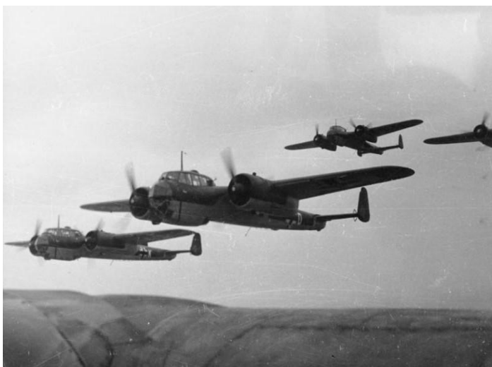
Немецкая авиация в годы войны