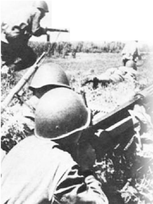
Бойцы одной из советских стрелковых дивизий