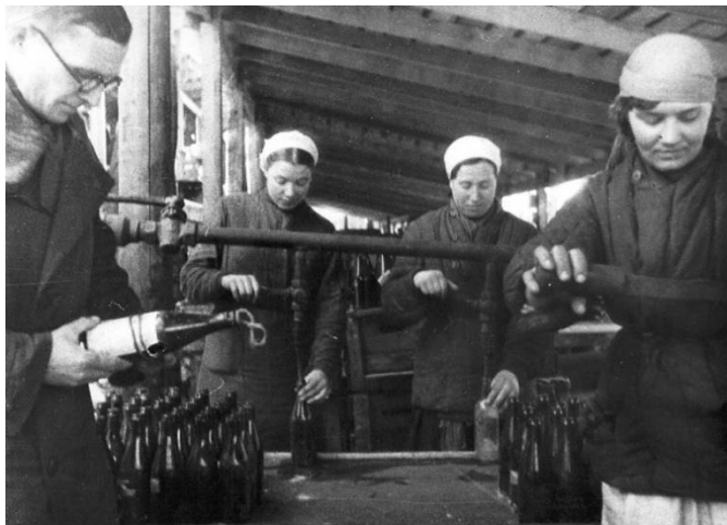
Изготовление снарядов на одном из заводов Москвы