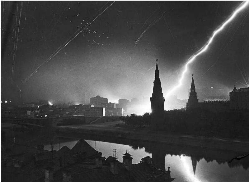
Налеты авиации на Москву в июле 1941 года

«Немцы стремились налетами авиации на Москву не только сжечь столицу, но и истребить ее население. Москва была их главной стратегической целью, а главнейшей задачей советской стратегии было Москву отстоять.»