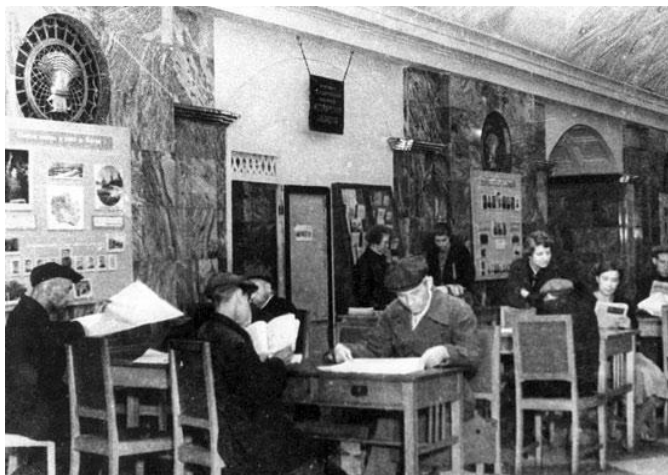
На станции метро