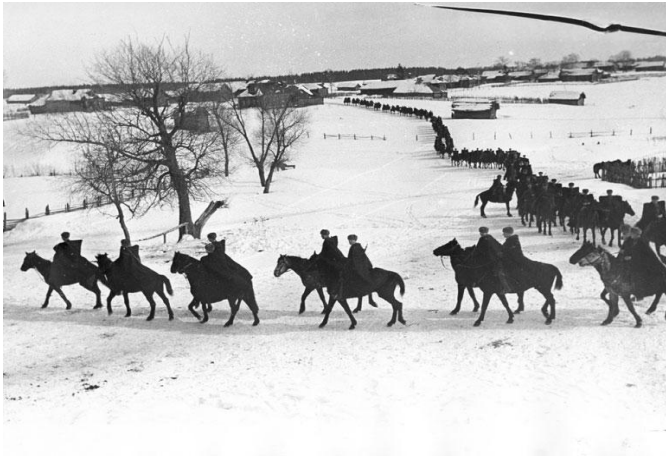
Кавалерийский корпус под Москвой в 1941 году