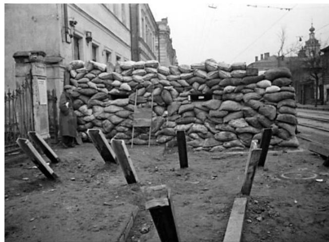
На одной из улиц столицы