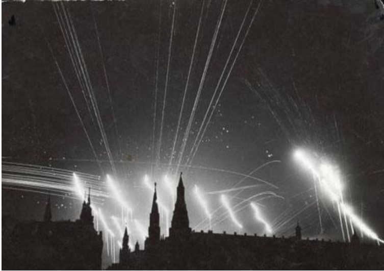
Налеты авиации на Москву в июле 1941 года

«Первый налет на Москву немцы совершили 21 июля в 22 часа. 220 самолетов охватывая Москву полукольцом, шли на разных высотах с интервалом 20-30 минут. По сигналу "Луч" вспыхнули световые поля подразделения (впечатление стены огня). В эту ночь было выпущено 30 000 снарядов, сбито 22 бомбардировщика. Обломки самолетов валялись или горели на Красной Пресне, в Кунцево, под Звенигородом, у Рублево.»