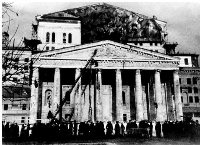
Маскировка Большого театра