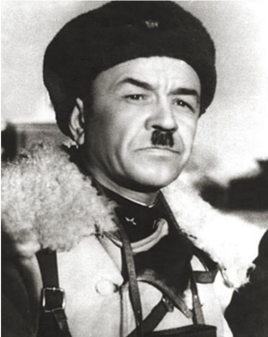
Панфилов Иван Васильевич 1892 – 1941 гг.

И.В.Панфилов командовал 316-й стрелковой дивизией, которой удалось задержать продвижение вражеских войск на Волоколамском направлении.