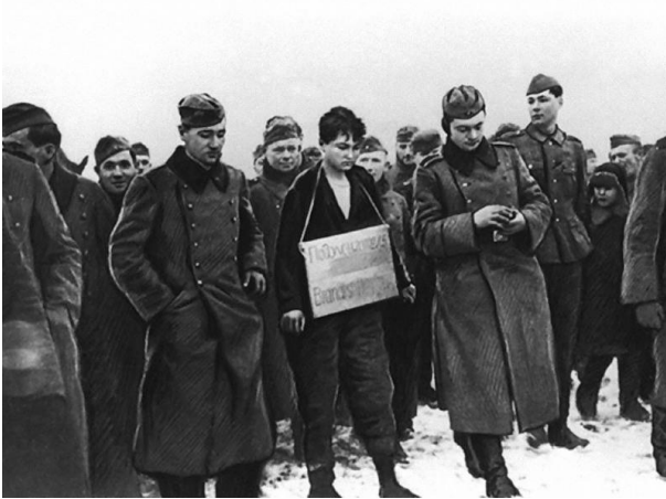
Немецкие солдаты ведут пленную на казнь