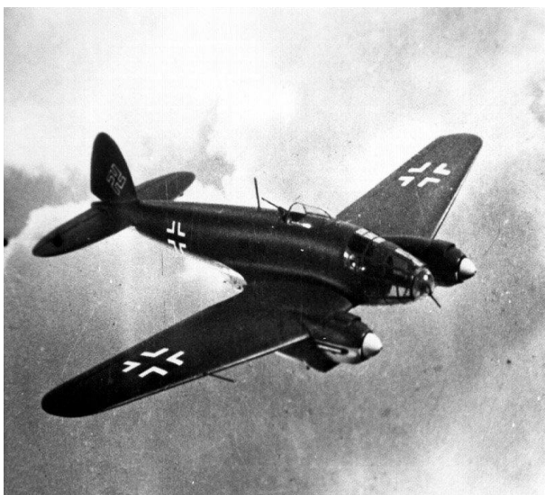
Немецкий бомбардировщик «Хейнкель-111»