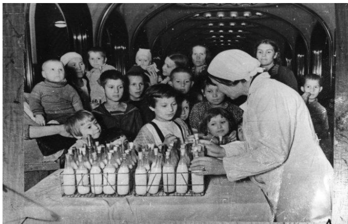
На станции метро Маяковская