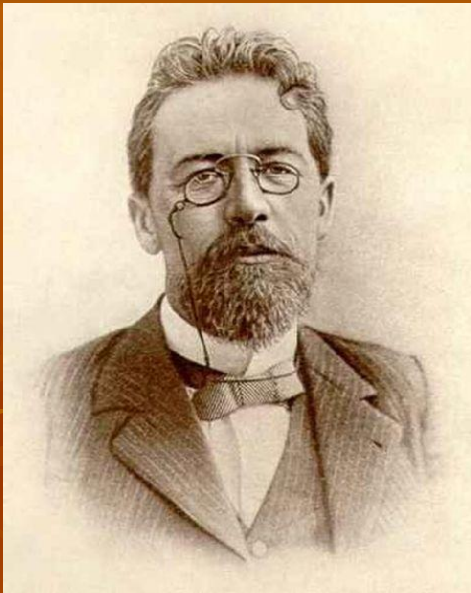
АНТОН ПАВЛОВИЧ ЧЕХОВ