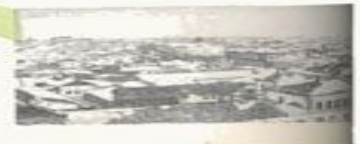
Уральск 1895 - 1907