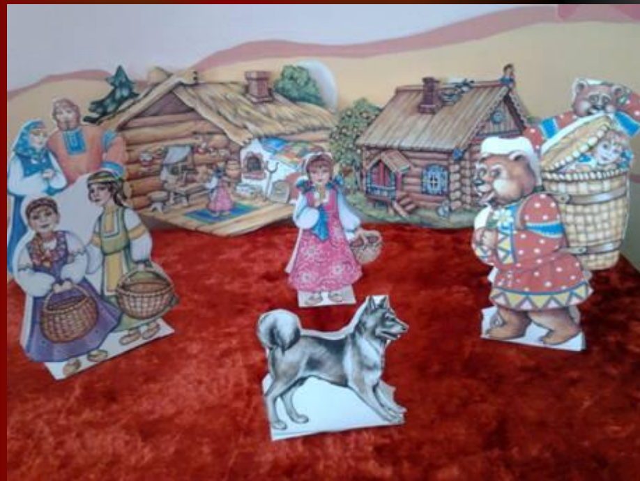
«Маша и медведь»