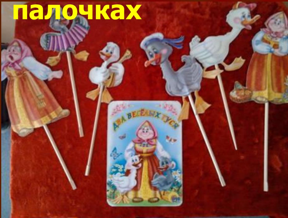
«Два веселых гуся»