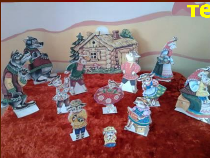
«Волк и семеро козлят»