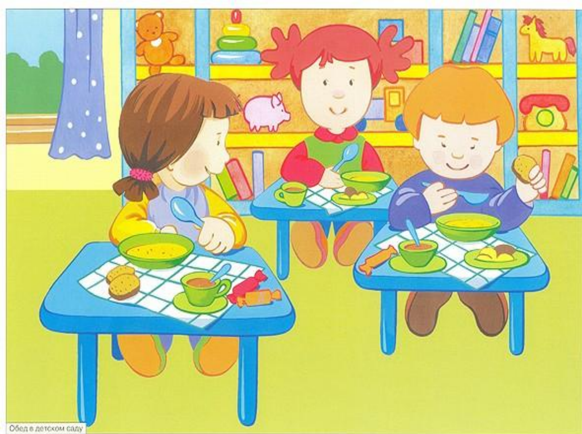
Обед в детском саду