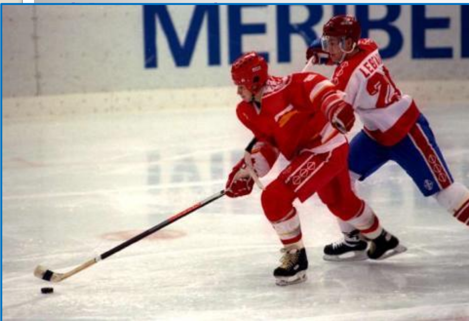
Хоккей с шайбой