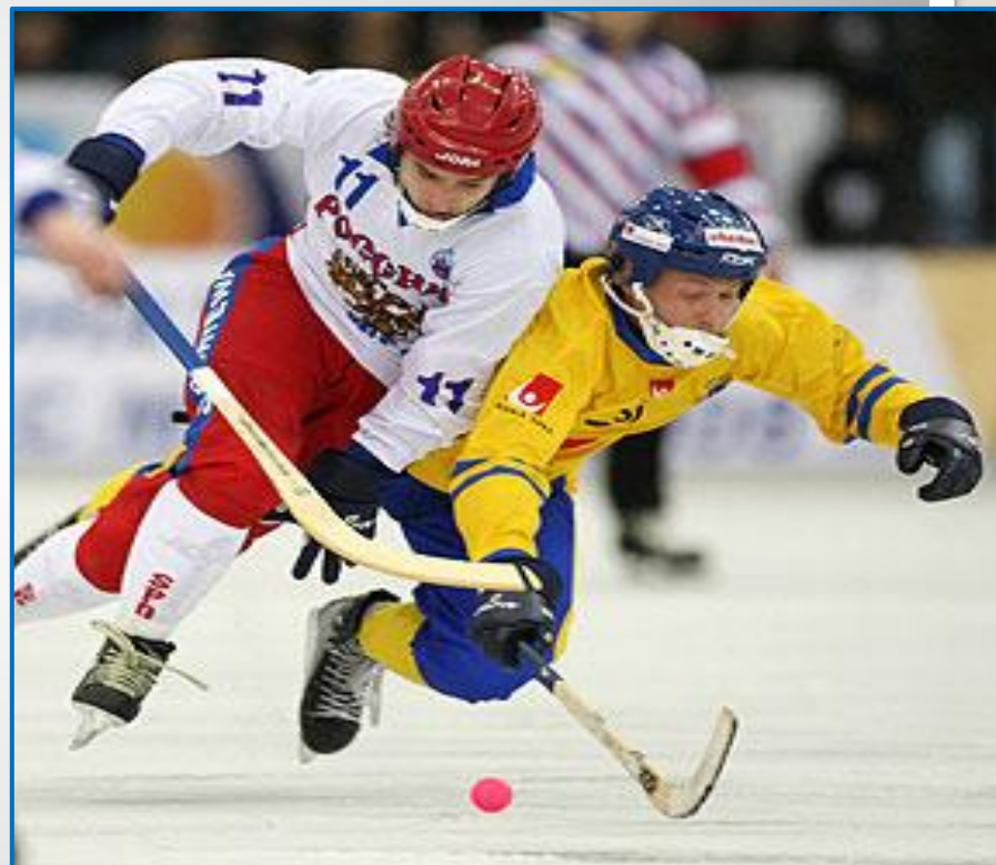
Хоккей с мячом