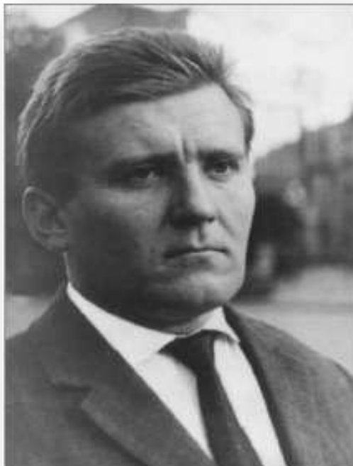
Виктор Владимирович Голявкин