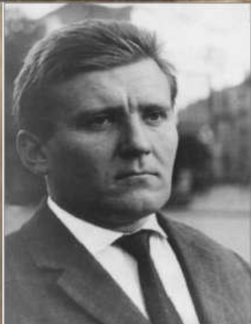
Виктор Владимирович Голявкин