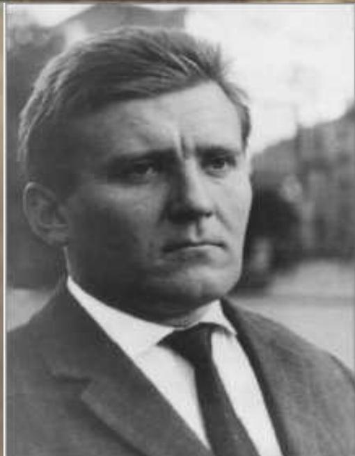
Виктор Владимирович Голявкин