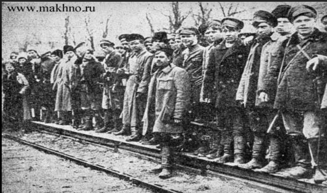
Отряд махновцев на станции Пологи.