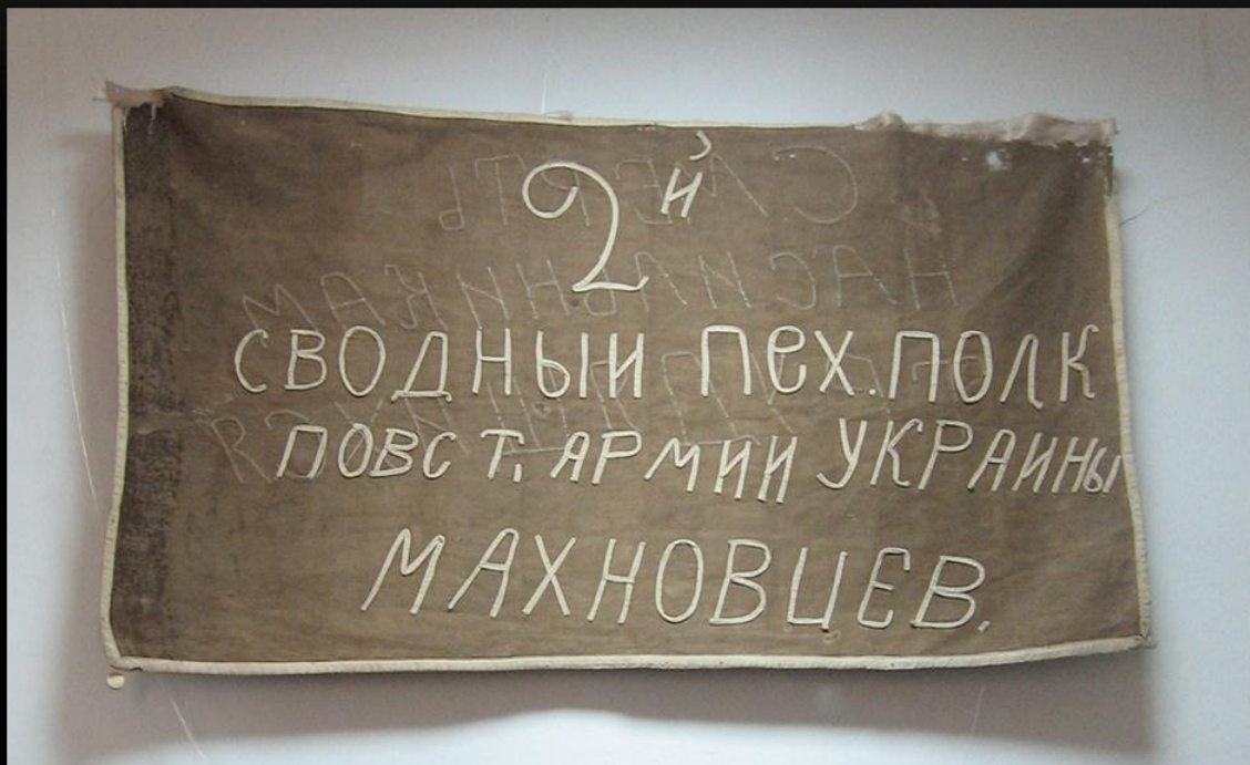
Флаг 2-го сводного полка махновцев