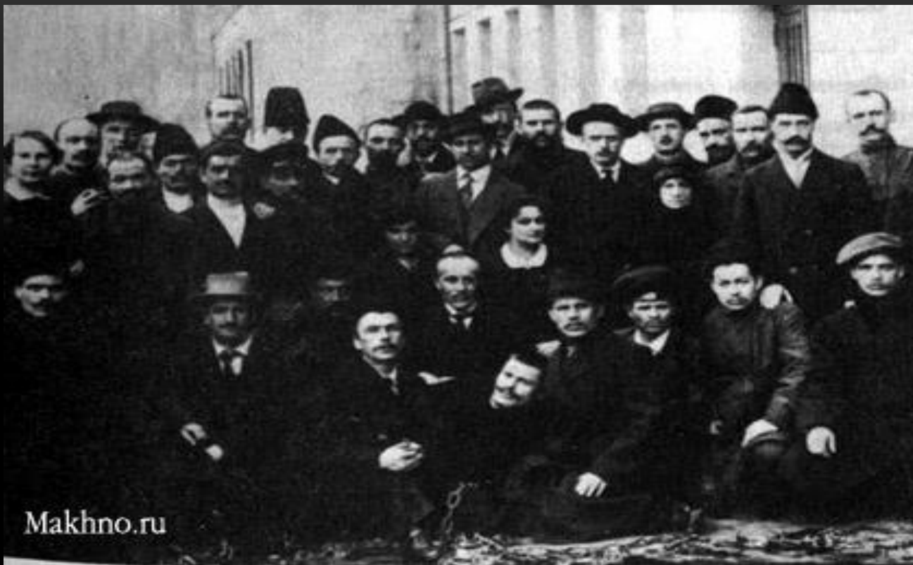
Группа узников Бутырской тюрьмы, освобожденных после Февральской революции 2 марта 1917 г. В первом ряду слева Н.И. Махно. В ногах у бывших арестантов кандалы.