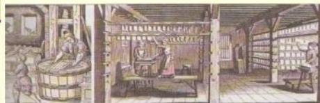
Первые заводы бумажного производства