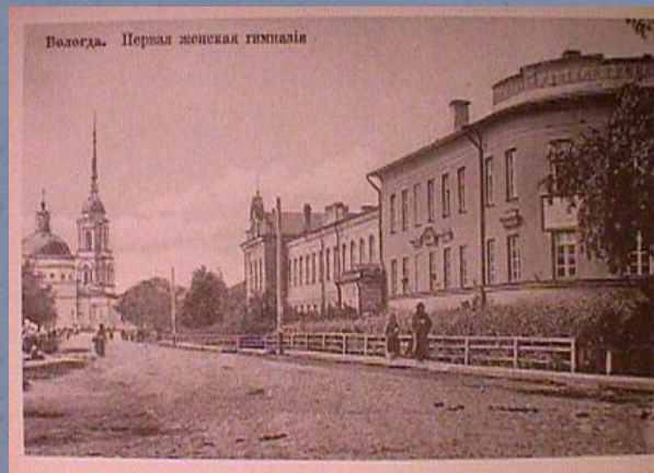
Волга. Первая женская гимназия