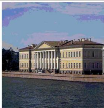
Здание Академии наук в Петербурге