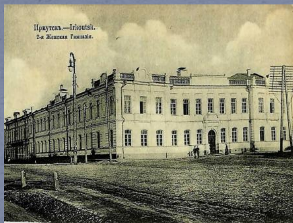
Иркутск.—Irkoutsk. 2-я Женская Гимназия.