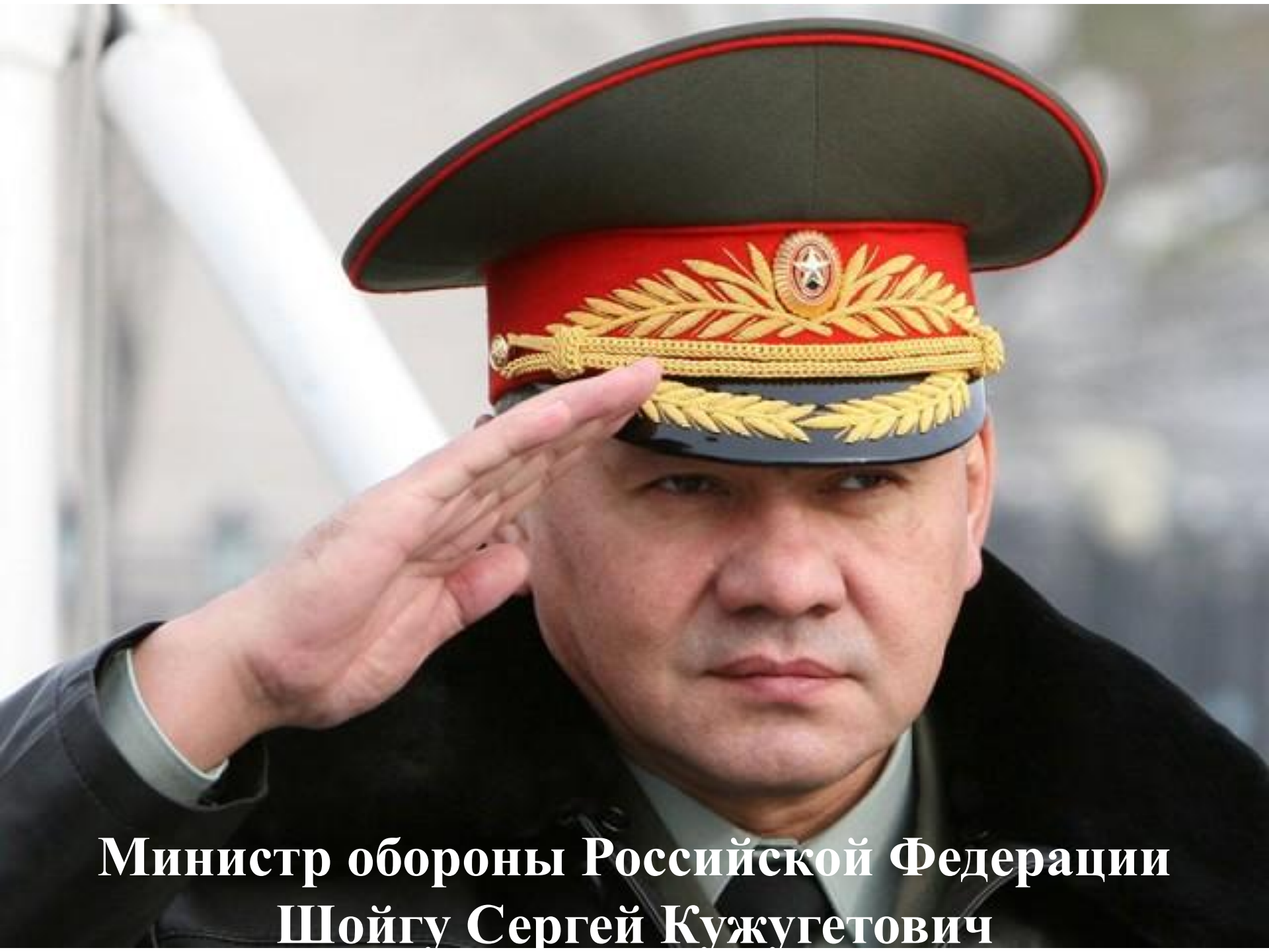
Министр обороны Российской Федерации Шойгу Сергей Кужугетович