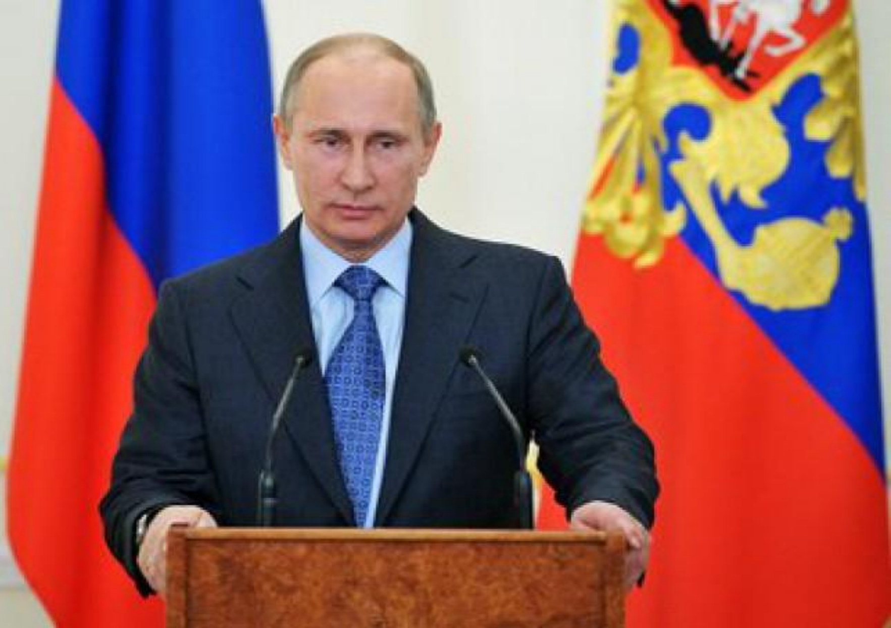
Президент Российской Федерации Владимир Владимирович Путин