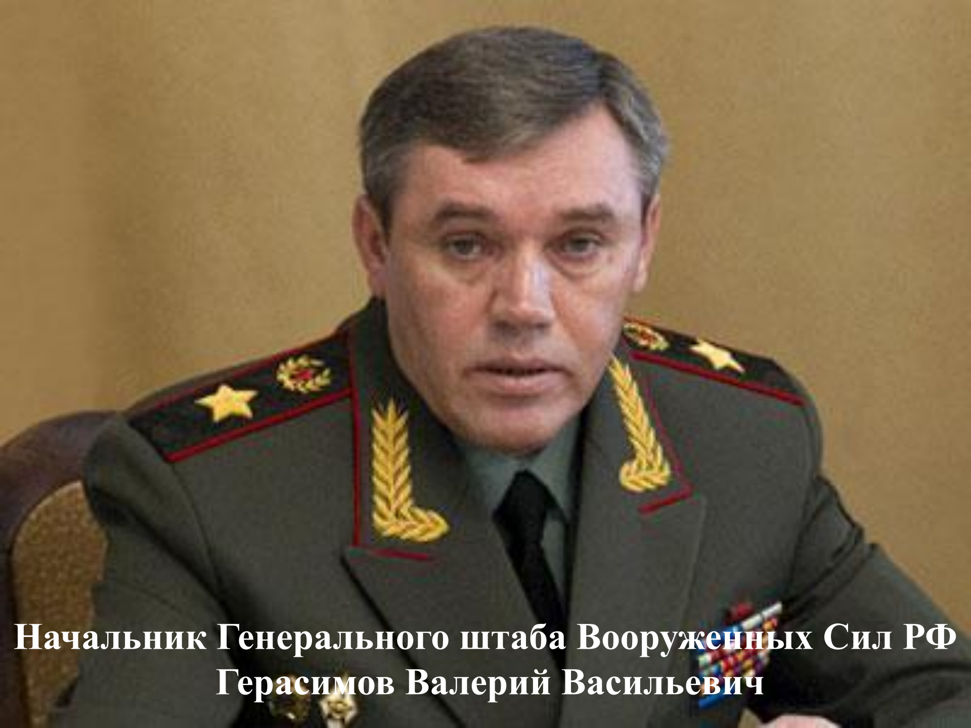
Начальник Генерального штаба Вооруженных Сил РФ Герасимов Валерий Васильевич