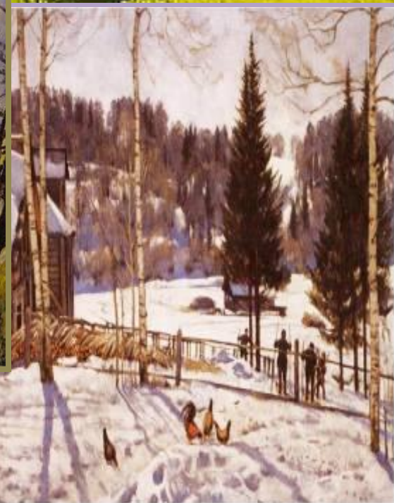
Иван Шишкин. Зимний день. 1929. Холст, масло. 80 x 112.