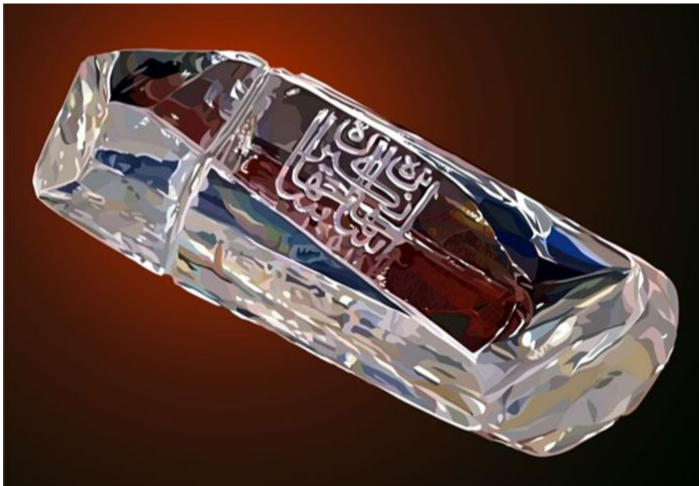
Алмаз «Шах» массой 87 карат (18г) преподнесён императору после смерти А.С. Грибоедова