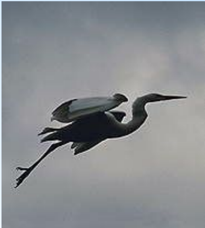
Цапля в полёте