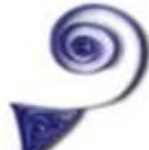
Комбинированная спиральная завиток