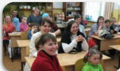
Итогом данного проекта явилось выступление перед родителями на родительском собрании.