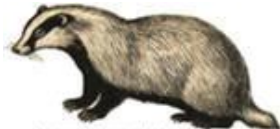
Барсук ( Meles meles L. )