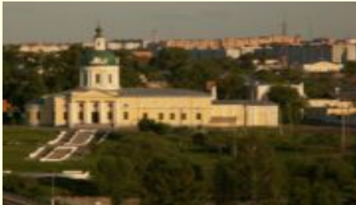
Церковь Михаила Архангела в Коломне. Арх. Шестаков Ф.М.