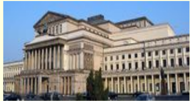
Большой театр в Варшаве.