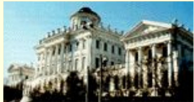
Особняк арх. А. Григорьев