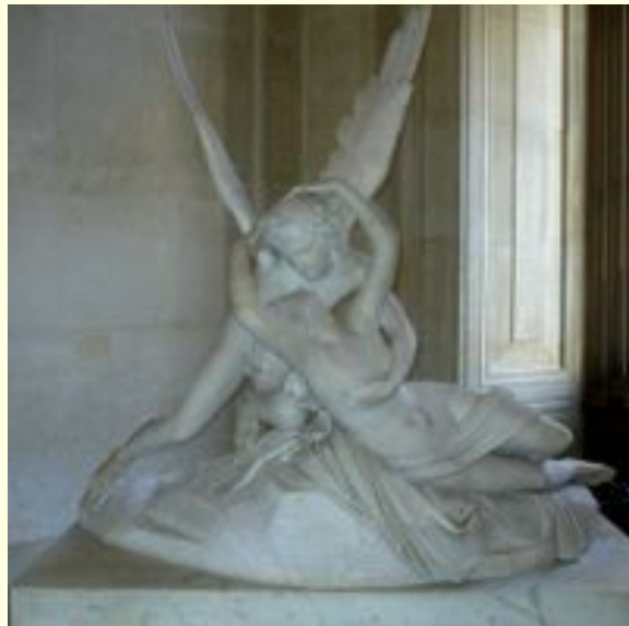
Антонио Канова Амур и Психея (1787-1793, Париж, Лувр)