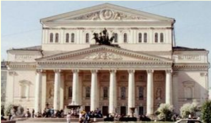
Большой театр в Москве.