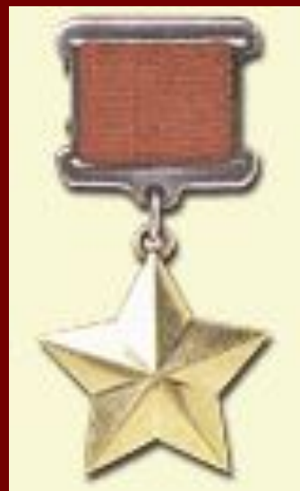
Медаль "Золотая Звезда"