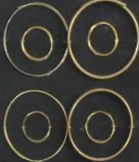
Прокатные листы Ø 4,1-12 мм