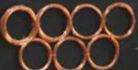
Прокатные заготовки Ø 2,20-5,5 мм