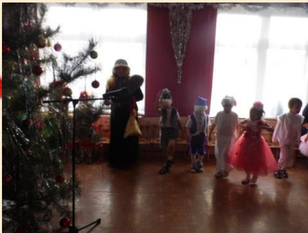
Мы встречаем Новый год