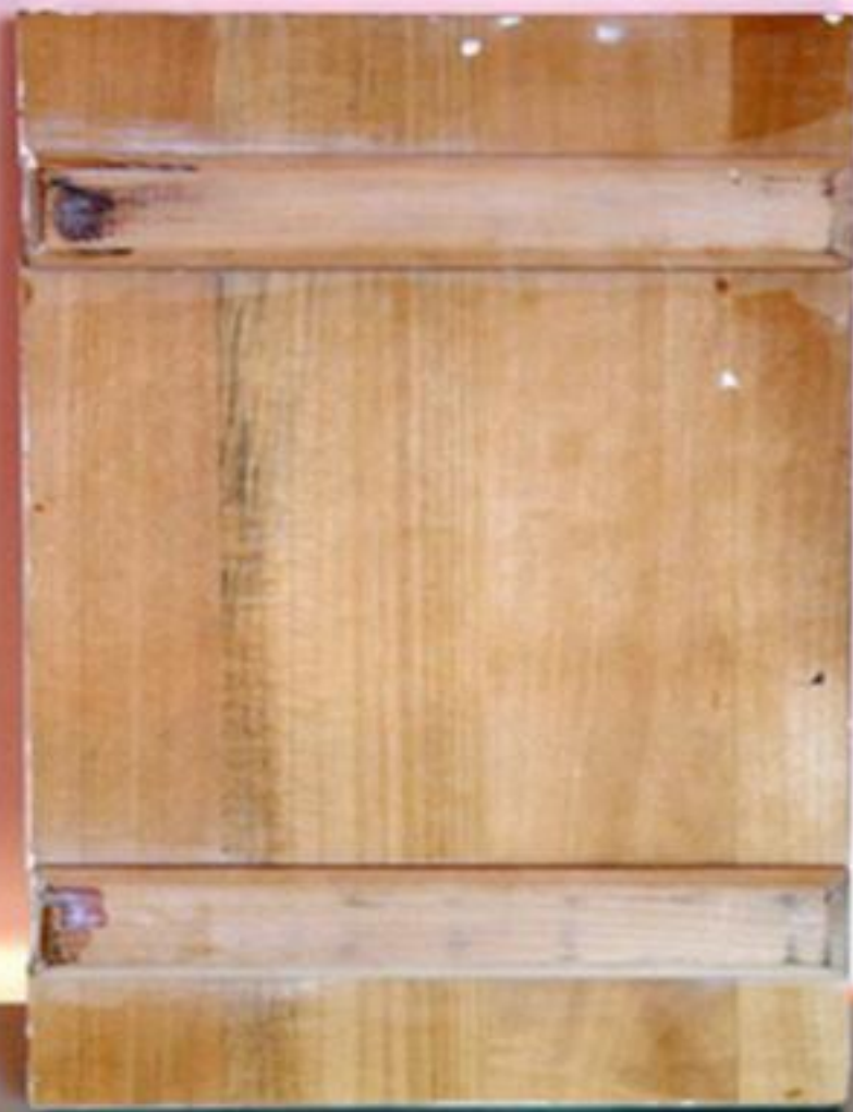
так выглядит готовая доска