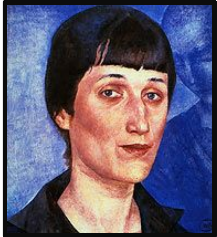
А. А. Ахматова. Портрет работы К. С. Петрова-Водкина. 1922. Холст, масло. Государственный русский музей, Санкт-Петербург.