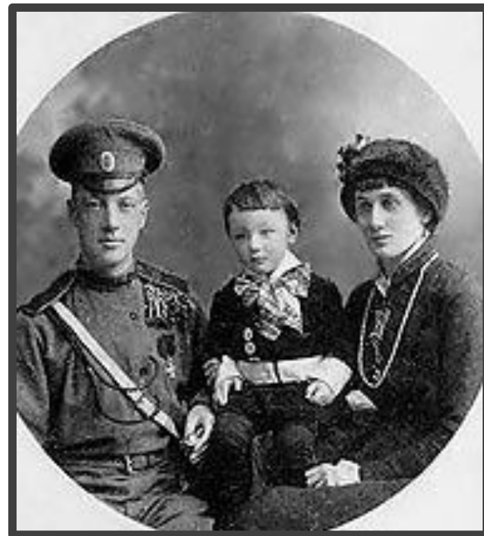
Анна Ахматова и Николай Гумилев с маленьким сыном — будущим знаменитым историком Л. Н. Гумилевым. 1915.