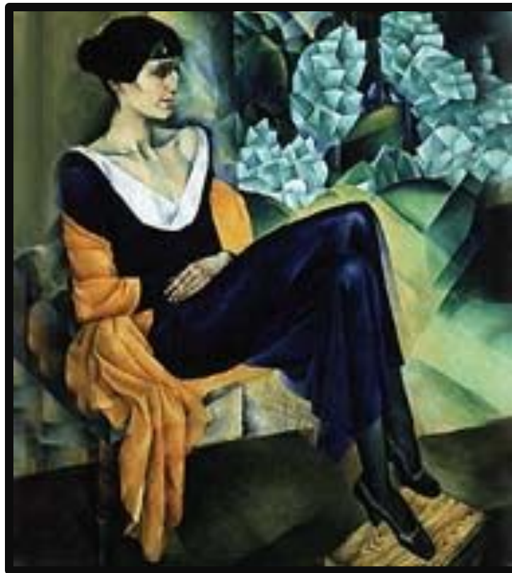
«Анна Ахматова». Портрет работы Н. И. Альтмана. 1914. Русский музей.