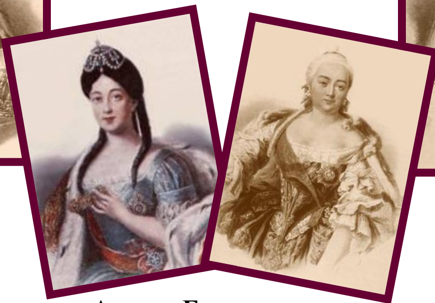
Анна и Елизавета Дочери Петра I