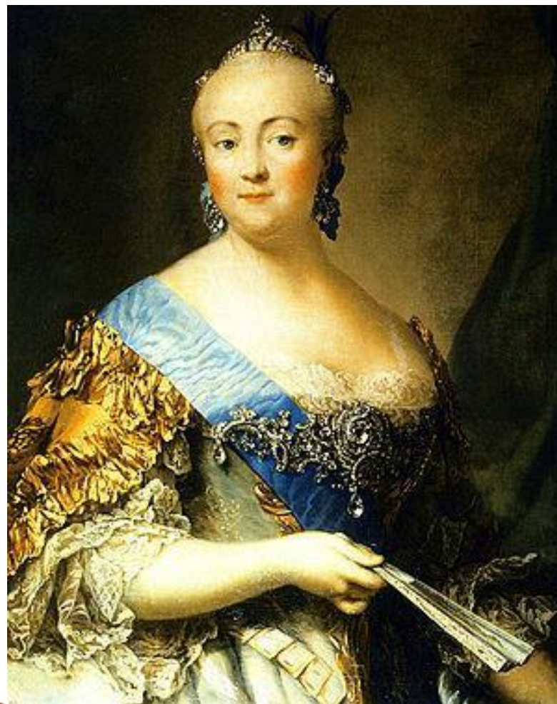
Елизавета Петровна (1741-1761)

В 1741 г. Елизавета Петровна, дочь Петра, при поддержке гвардии, совершила новый дворцовый переворот. Иностранцы были удалены от двора, государством управляли способные государственные деятели из русского дворянства.