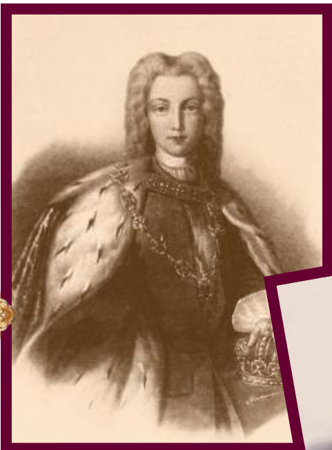
Петр (сын царевича Алексея)