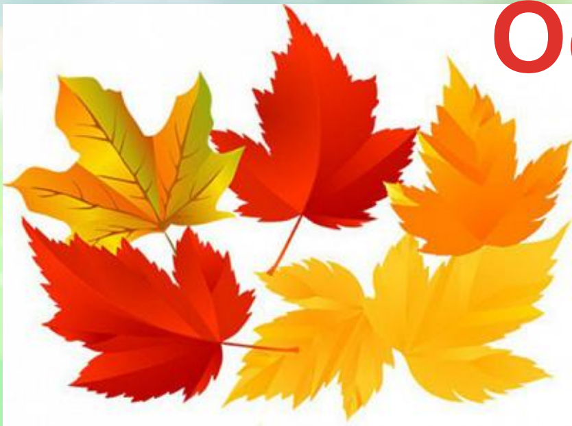
(Осень – жёлтые, оранжевые и красные листья)

Наступает самое разноцветное время года осень. Теплые летние деньки уступают прохладным осенним дням, начинает желтеть и сохнуть трава. На деревьях желтеют листья, а на веточках рябины появляются красные ягоды. Золотятся березы, желтеет дуб, опадает клён и весь лес устелен оранжевым ковром из желтых, красных и других оттенков листьев.