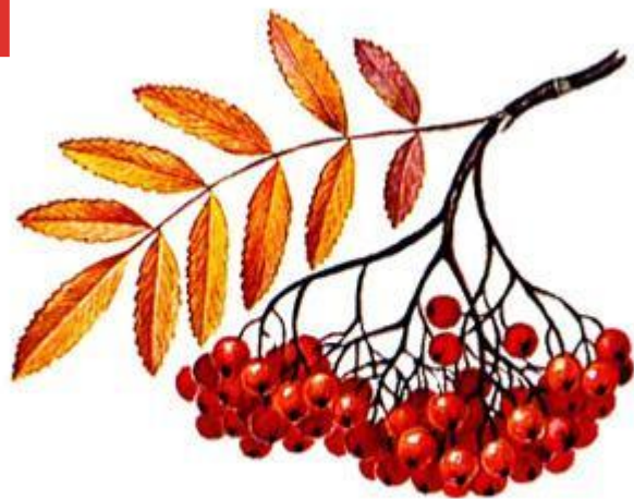
(Осень – красная рябина)

Наступает самое разноцветное время года осень. Теплые летние деньки уступают прохладным осенним дням, начинает желтеть и сохнуть трава. На деревьях желтеют листья, а на веточках рябины появляются красные ягоды. Золотятся березы, желтеет дуб, опадает клён и весь лес устелен оранжевым ковром из желтых, красных и других оттенков листьев.