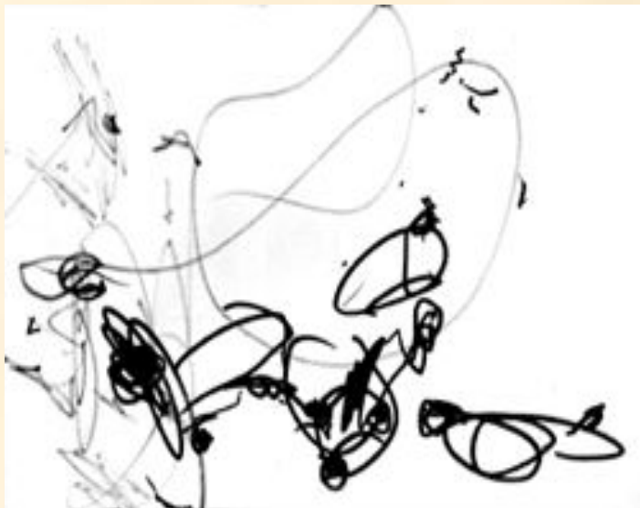
Рис. 1. Катя, 1 г. 9 мес.

Дети очень любят рисовать. Как только маленькая ручка становится способной ухватить карандаш, сразу же у ребенка появляется стремление что-то изобразить на листе.