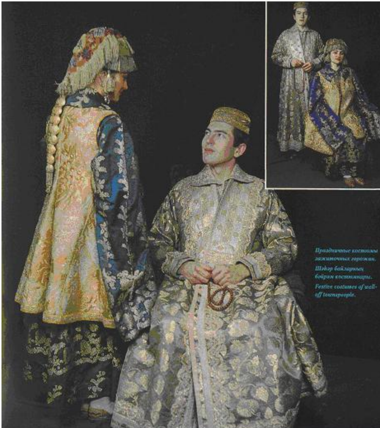
Праздничные костюмы ложичных горожан. Шўёр байлардан байрам кийимлари. Festive costumes of well- off townpeople.