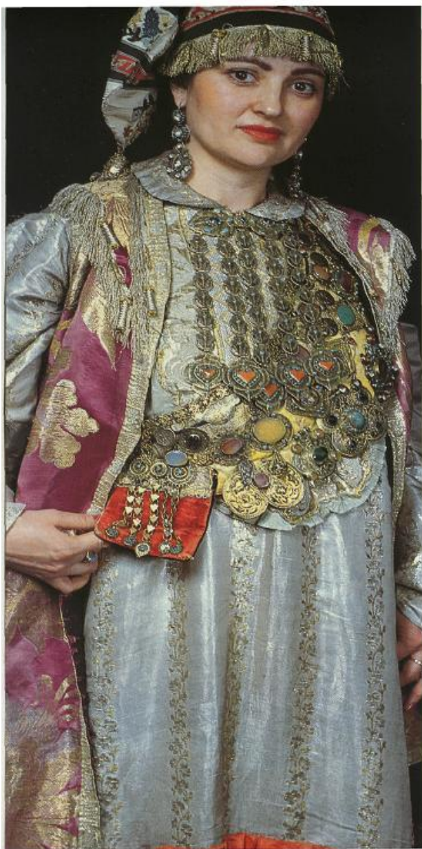
Женский костюм с нагрудной тканевой аппликацией "изу" и перевязью "хасите". Күррәк олешендә тукыма аппликацияле изүе һәм бәйләвеч хаситәсе булган хатыйн-кыз костюму. Woman's costume with izyu ruffle and khasiteh sash/belt.