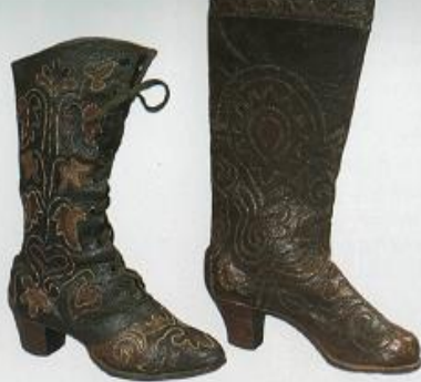
Изделия татарских мастеров-учеников: ботинки, сапоги, крой голенищ сапог.

Татар читекче осталарының эшләмәләре: ботинкалар, читеклар, итек курьсларының киселеше.