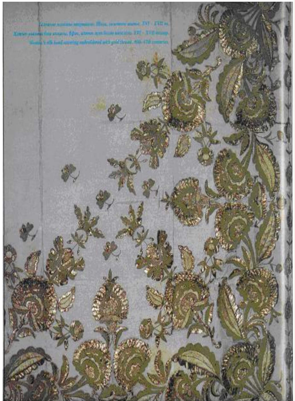
Түбән катлам өрмөкчү. Шөп, өлөкчө түбүн. 191 - 192-ж. Түбүн катлам баш кычы, 190, алтын түбүн кычы. 197 - 198-жылдар. Women's silk head covering embroidered with gold thread. 191-192 centuries.