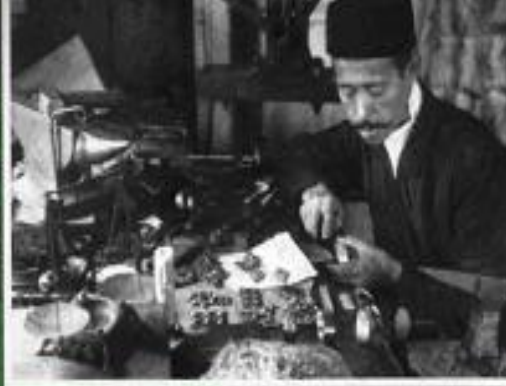
Эбучер аз рӯйбароқ. Ҷомма, Ҳисорро XX ғ. Аҷраби фармоғи аз ҷаҳоншоно. Ҷомма, XX ғ.и Ҷомма the view of work. Photo. Early 20th century