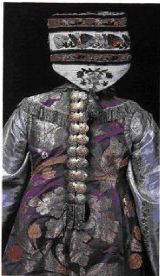
Наколемня – меджа, Түзаш, жетонны, баклы. Тузмашлар. Түзашма, жетоннар, жаз татпарлар. Tuzmash hair ornament on textile base with medals and plaques.