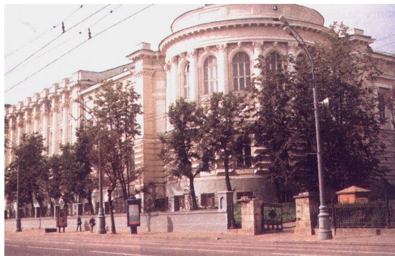
Здание научной библиотеки МГУ имени М.Горького