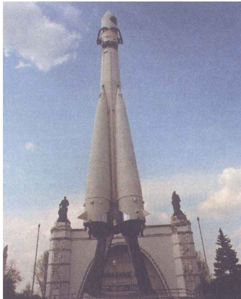
Ракета-носитель «Восток» перед главным входом в павильон «Космос» во Всероссийском выставочном центре