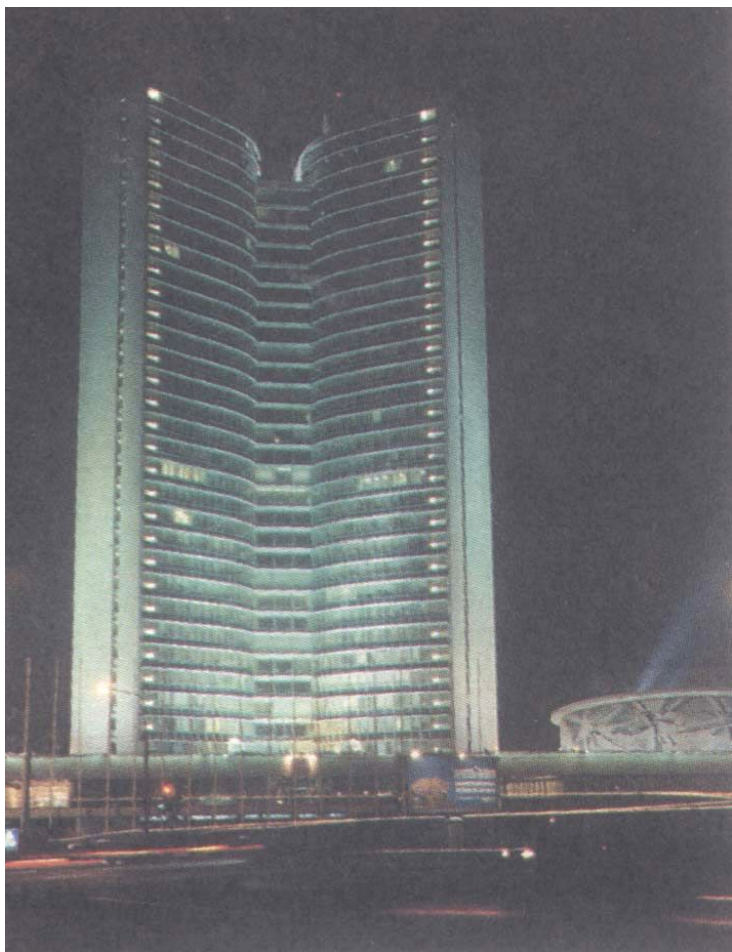
Административное здание на Новом Арбате