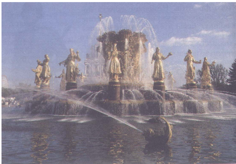
Фонтан «Дружба народов» во Всероссийском выставочном центре Сооружен в 1957г.