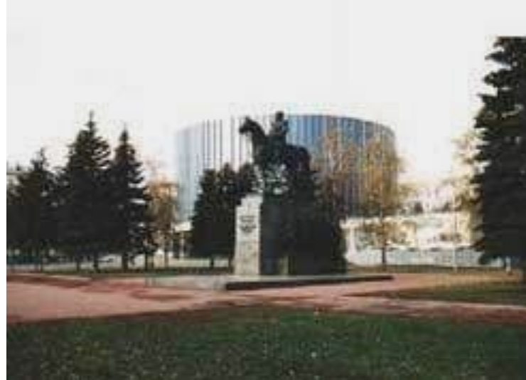
Панорама "БОРОДИНСКАЯ БИТВА"