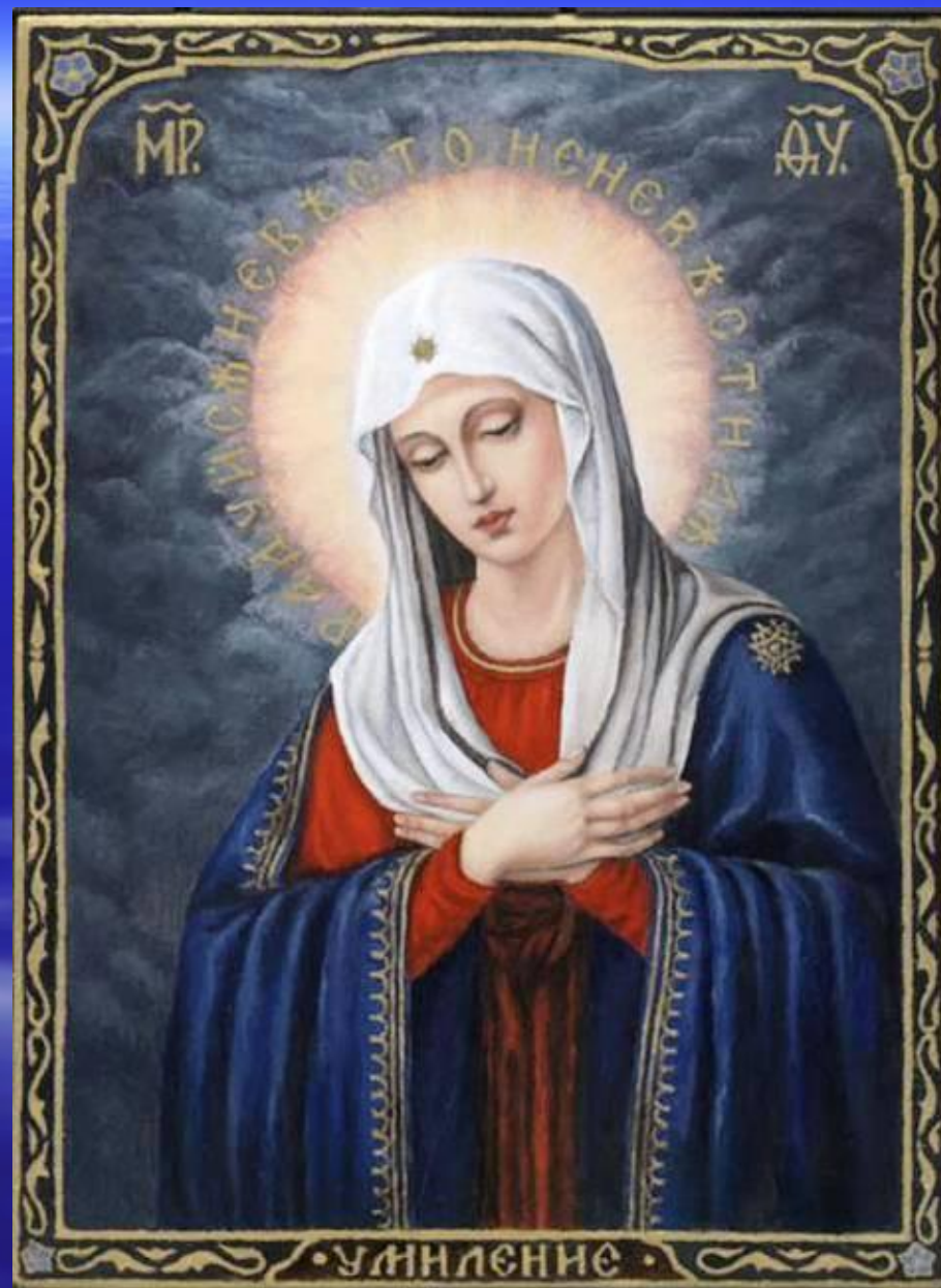
Икона Божией Матери «Умиление»