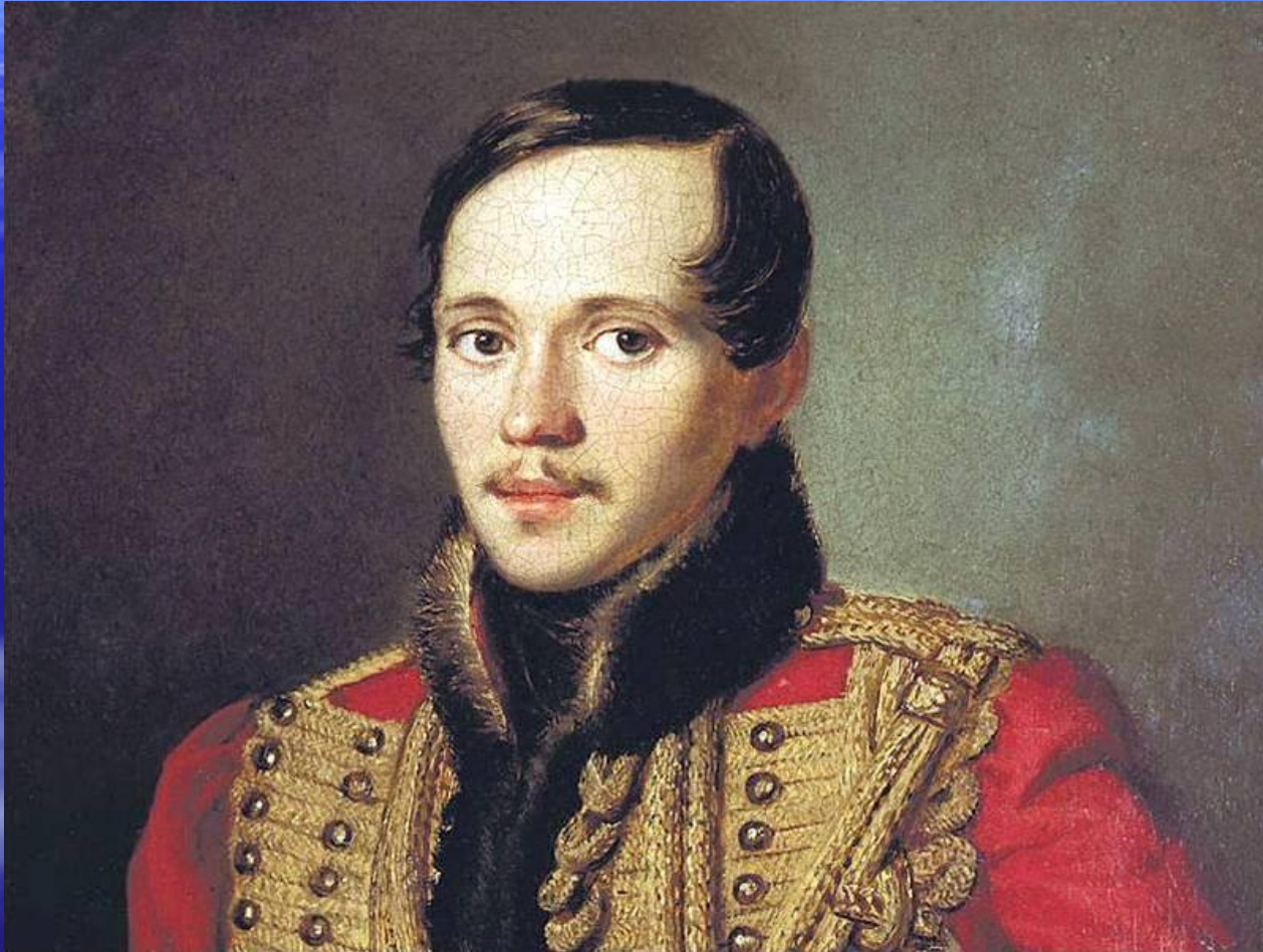
Заболотский П.Е. Портрет поэта М. Ю. Лермонтова. 1837. Из коллекции Третьяковской галереи.