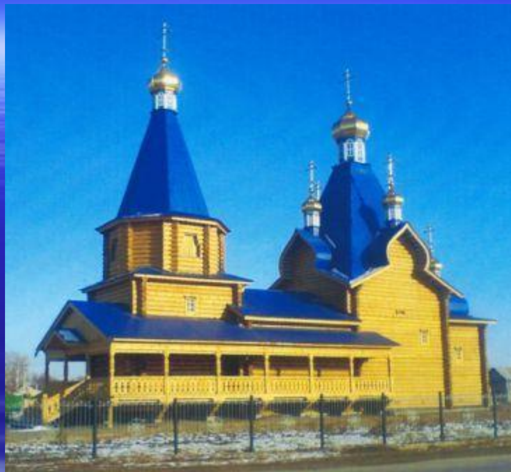
Храм Святого Архистратига Божия Михаила