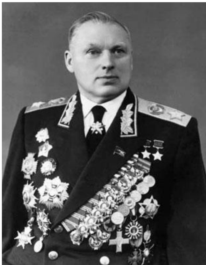
Рокоссовский К. К., маршал СССР