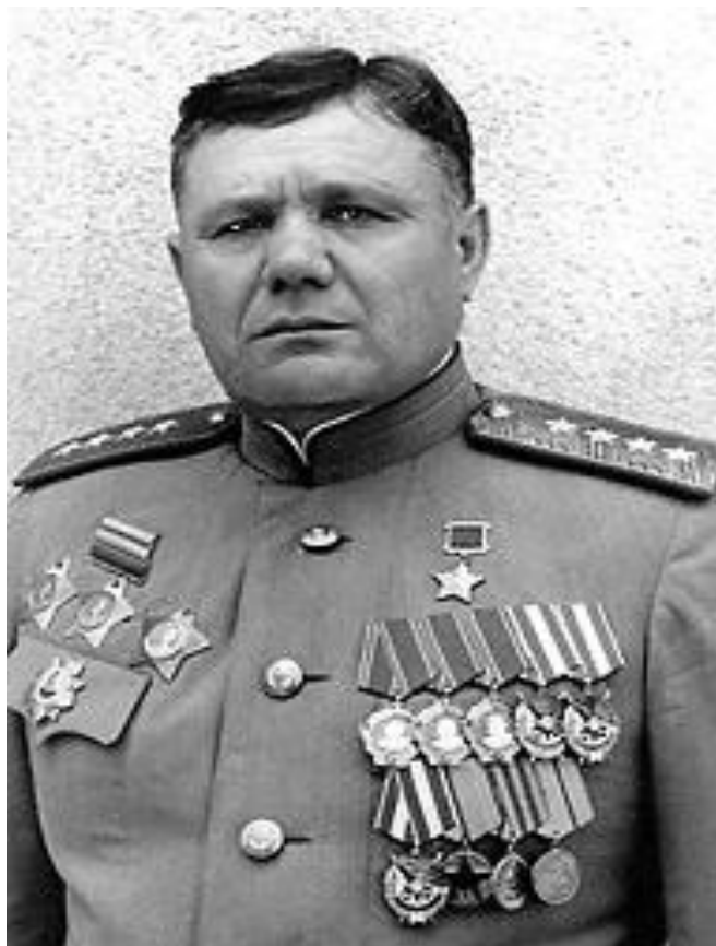
Еременко А.И., Маршал СССР.