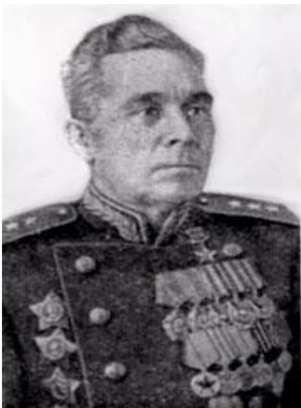
Гордов В.Н., Генерал- полковник СССР