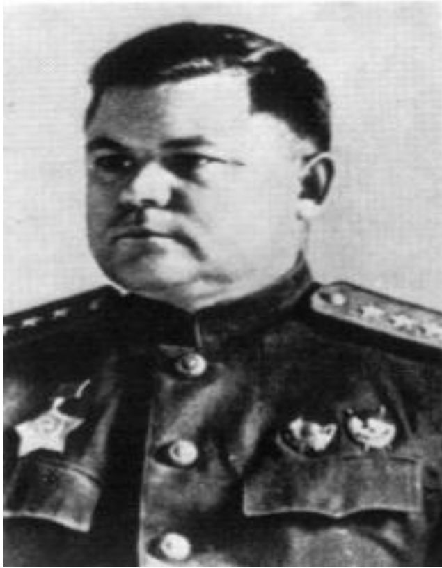
Ватутин Н.Ф., Генерал советской армии