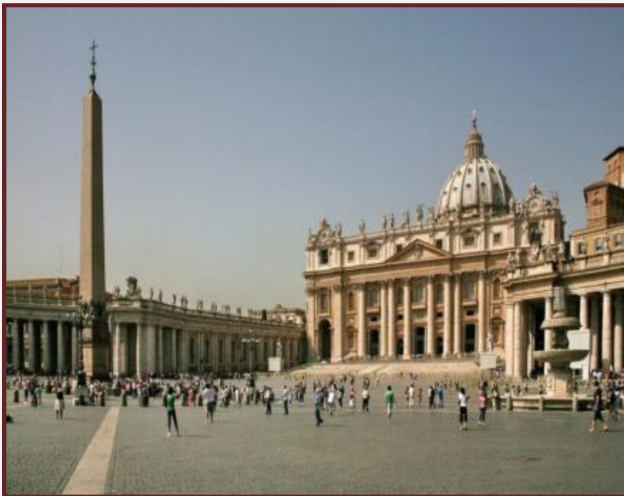
Собор Святого Петра