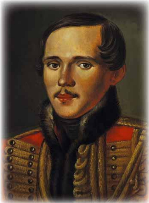
Лермонтов Михаил Юрьевич (15.10.1814-27.07.1841)