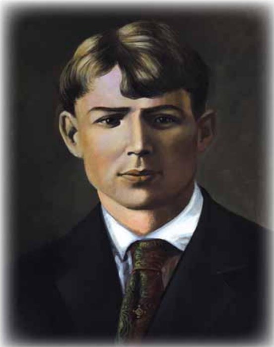
Есенин Сергей Александрович (03.10.1895-28.12.1925)