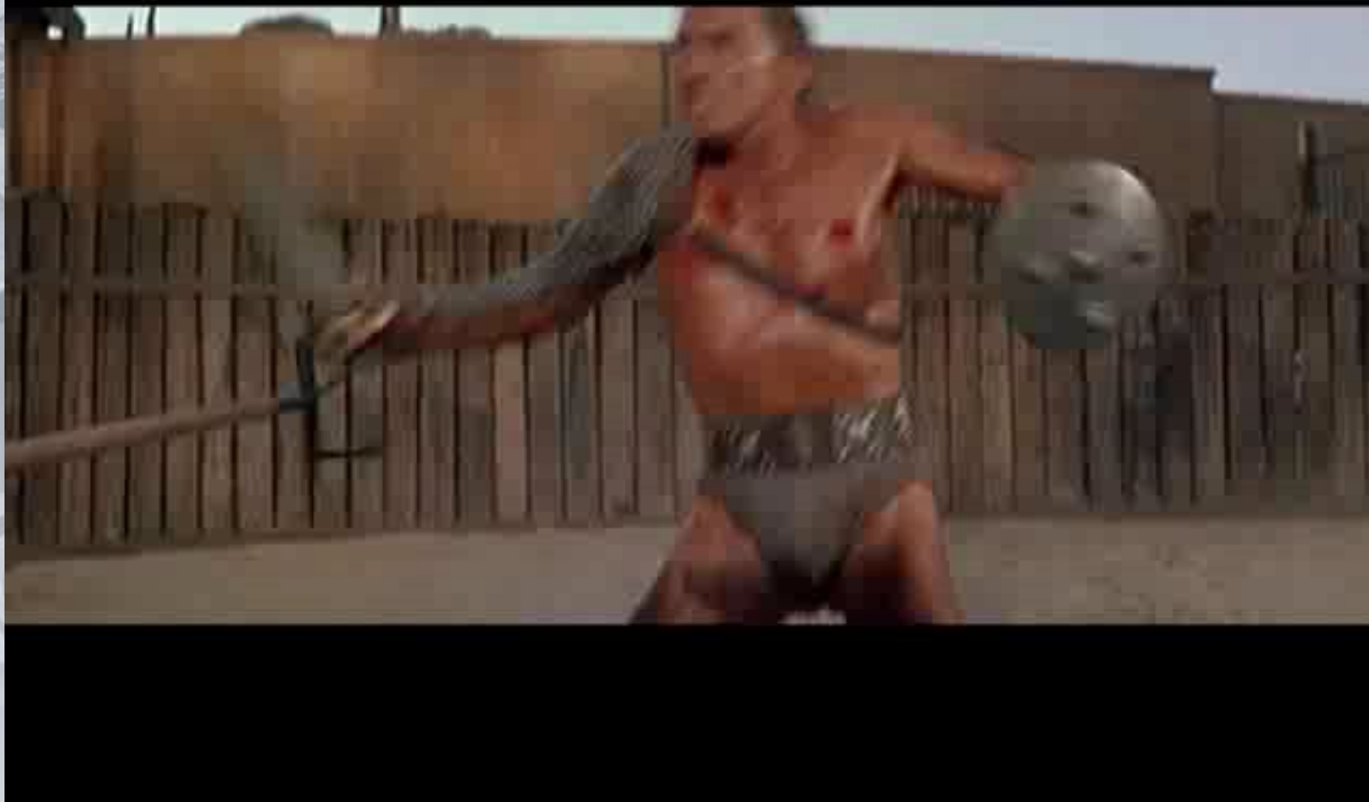
ФРАГМЕНТ ИЗ ХУДОЖЕСТВЕННОГО ФИЛЬМА «СПАРТАК» РЕЖИССЕР С. КУБРИК. 1960 Г.