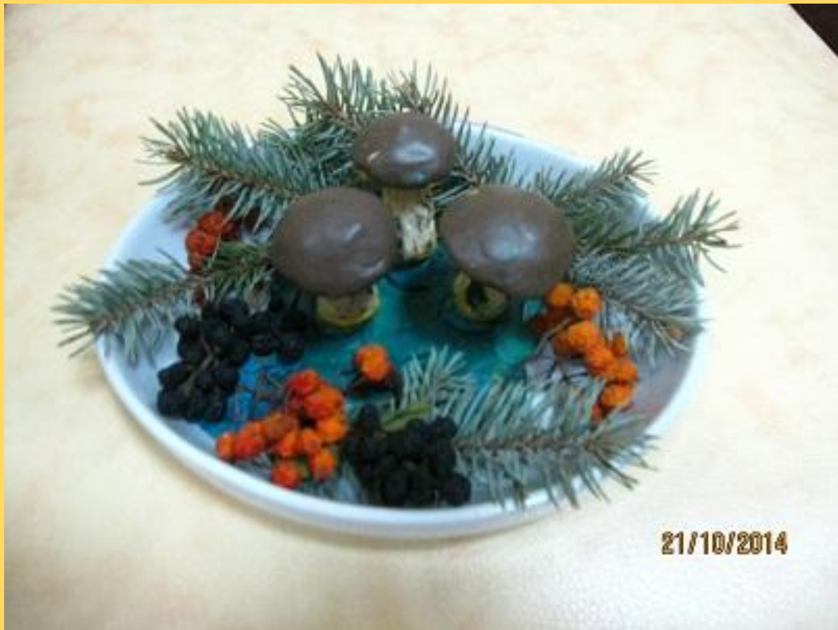
Поделка семьи Саши Лагодина «Грибы».