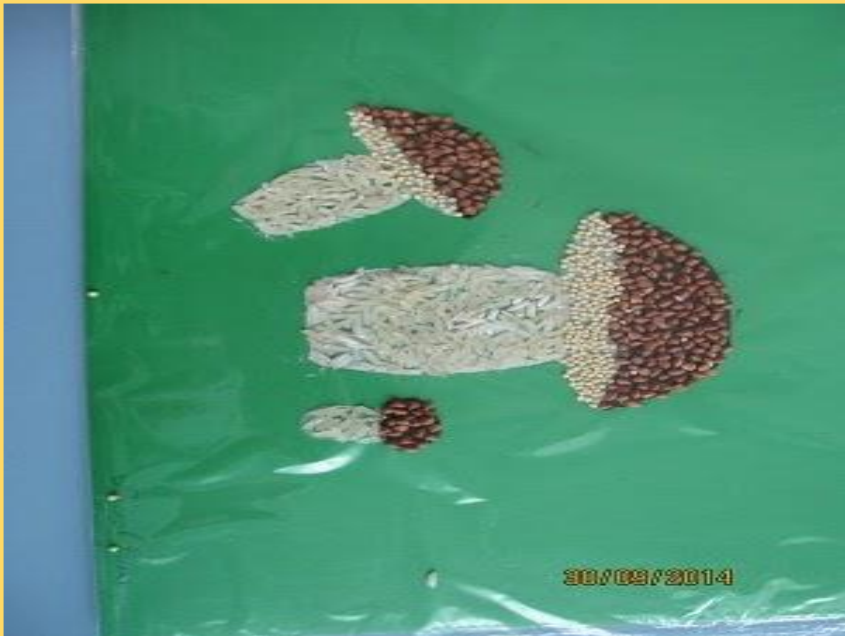
Подделка семьи Димы Тишкова.