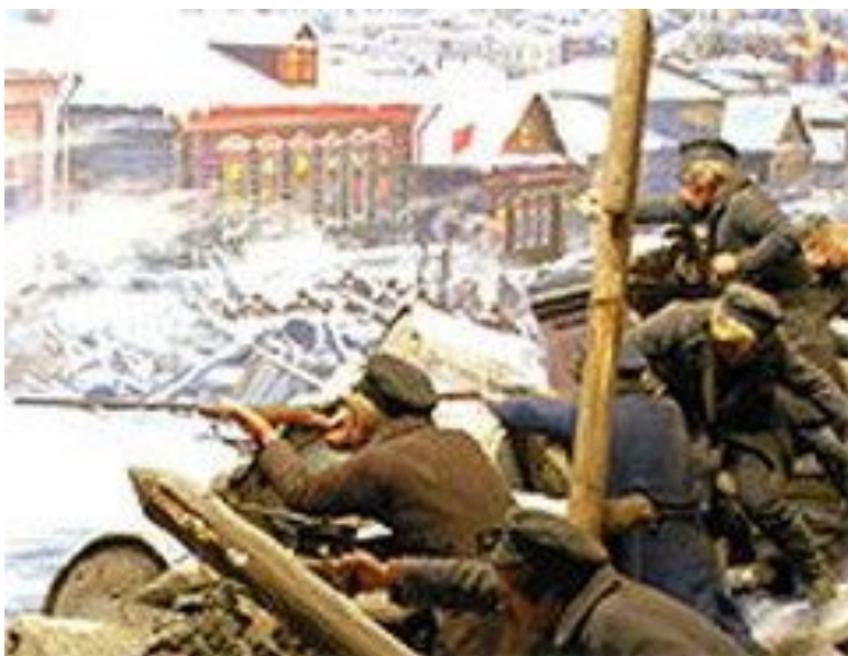
Начало всеобщей стачки рабочих Иваново-Вознесенска

После получения известия о поражении армии и флота по стране прокатилась волна первомайских демонстраций. В Иваново-Вознесенске рабочие взяли власть в свои руки и организовали для управления городом Совет . Он образовал рабочие дружины и кассы взаимопомощи, заставил предпринимателей повысить зарплату и пойти на другие уступки.