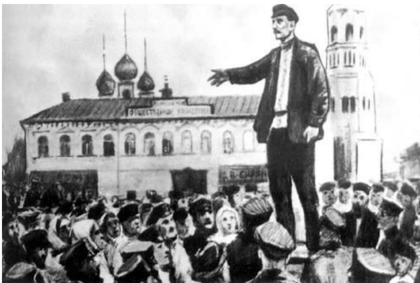
Первый общегородской Совет рабочих депутатов. Революционная волна, вызванная расстрелом мирной демонстрации 9 января 1905

Вечером в городе начались массовые беспорядки. Рабочие захватывали склады с оружием, возводили баррикады.