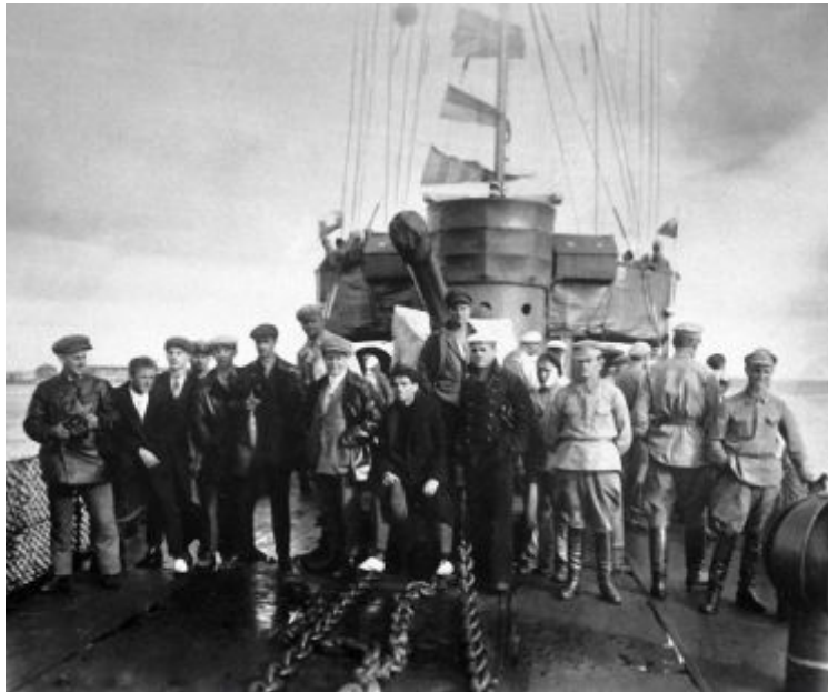
Восстание на броненосце «Потемкин»

В июне произошло восстание на броненосце «Потемкин» . Поводом стал приказ о расстреле матросов отказавшихся есть борщ из протухшего мяса. В ходе восстания 7 человек офицеров было убито. Командир и врач были расстреляны. На других судах Черноморского флота восставших не поддержали.