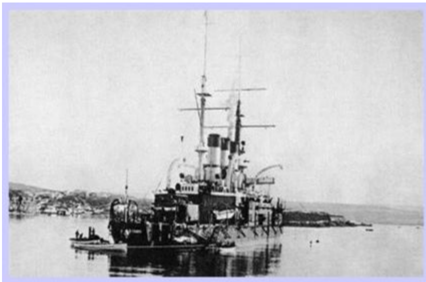
Броненосец «Князь Потемкин- Таврический».

Государственной думе подготовленный А.Булыгиным Дума становилась законосовещательным органом, выборы происходили по трем куриям на основе высокого имущественного ценза, многие слои населения были лишены избирательных прав. Проект был встречен отрицательно и не был осуществлен.