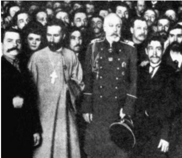
Гапон и Фуллон

3 января 1905 г. в ответ на увольнение нескольких рабочих началась забастовка на Путиловском заводе. Ее организовал профсоюз во главе со священником Г.Гапоном, который был близок к петербургскому градоначальнику А.Фулону