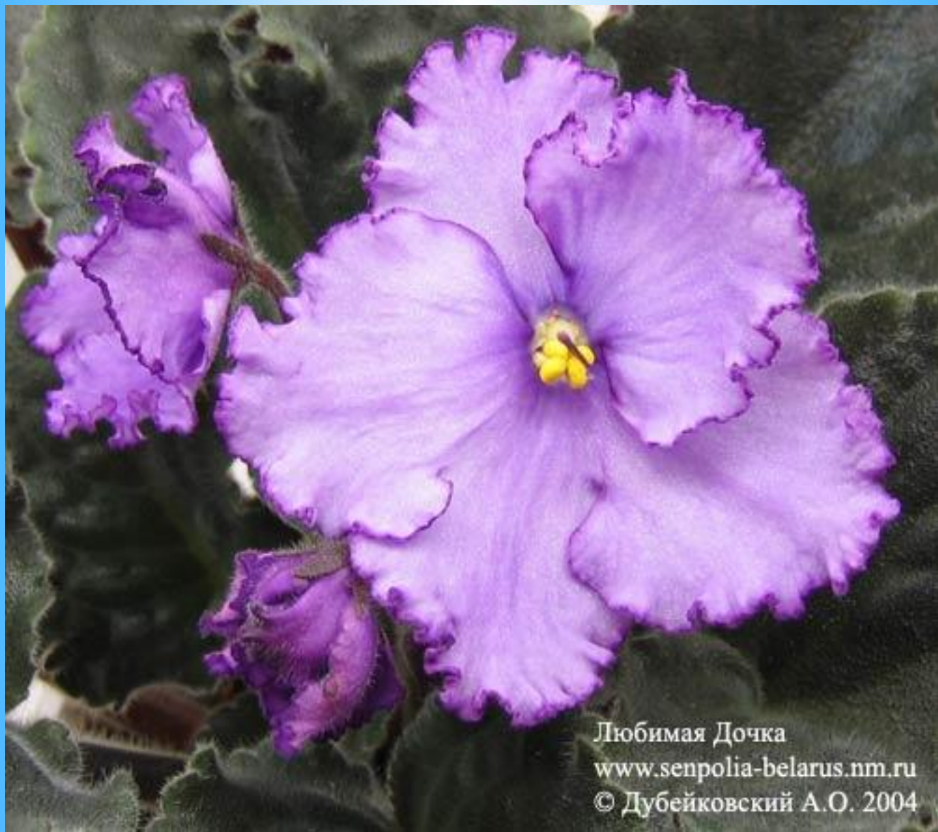
Любимая Дочка www.senpolia-belarus.nm.ru © Дубейковский А.О. 2004