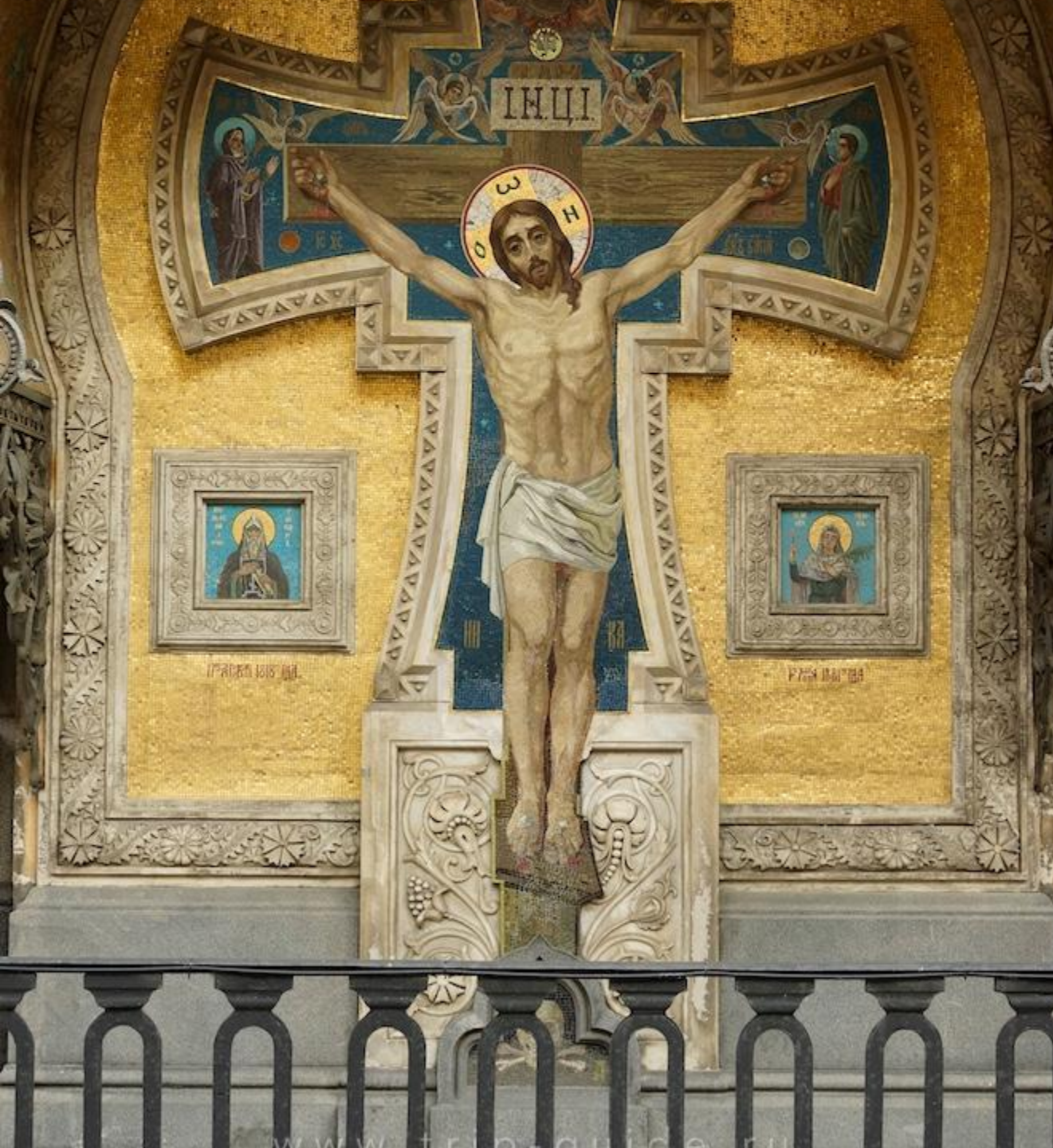
The mosaic panel "Crucifixion" decorates the western facade.