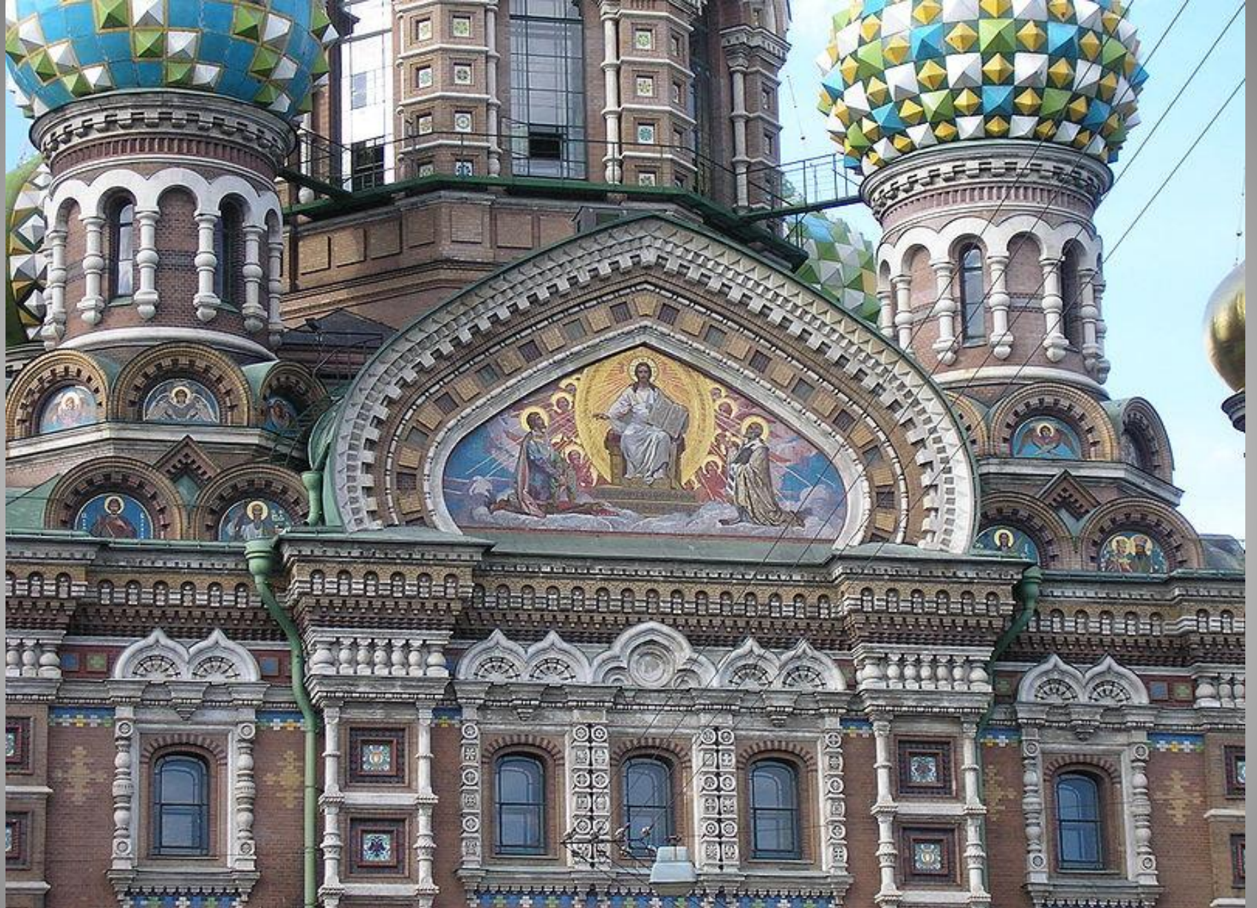
The panel depicting “Christ in Glory” decorates the southern façade.