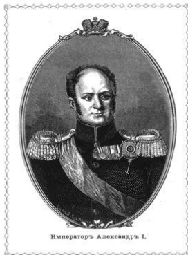
Императоръ Александръ I.

Обыкновенное подавие нищим, умножая только число оных, не упоконитъ старца, отможенного лѣтами, не возвратитъ здоровья юношѣ, увидавшему на зарѣ дней своих, не избавитъ отъ смерти или порока младенца, долженствующаго быть подпоркою отечества. Не рѣдко также наглый тунеядецъ похищаетъ отъ руки благотѣльной то, что назначено было отцу семейства, томящемуся на одрѣ смерти и отчаянїи. Изъ сего слѣдуетъ, что разстрогаемымъ быть наружнымъ и весьма часто обманчивымъ выдохъ нищеты и убожества, не есть еще благодѣяніе. Надлежитъ искать несчастныхъ въ самыхъ жилищѣ ихъ—въ сей обители плача и страданїи. Ласковымъ обращенїемъ, спасительными совѣтами, словомъ всѣми нравственными и физическими способами стараться облегчить