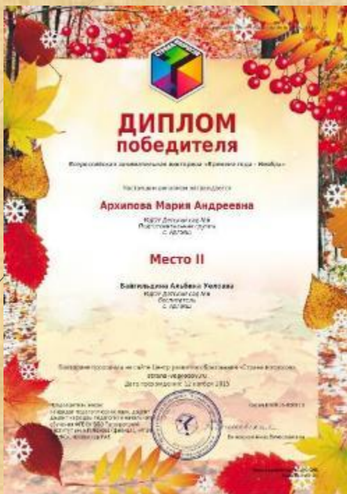
Диплом победителя всероссийской занимательной викторины «Времена года - Ноябрь»