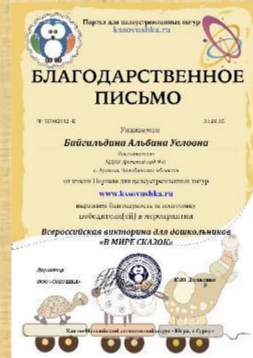
Благодарственное письмо за подготовку победителя