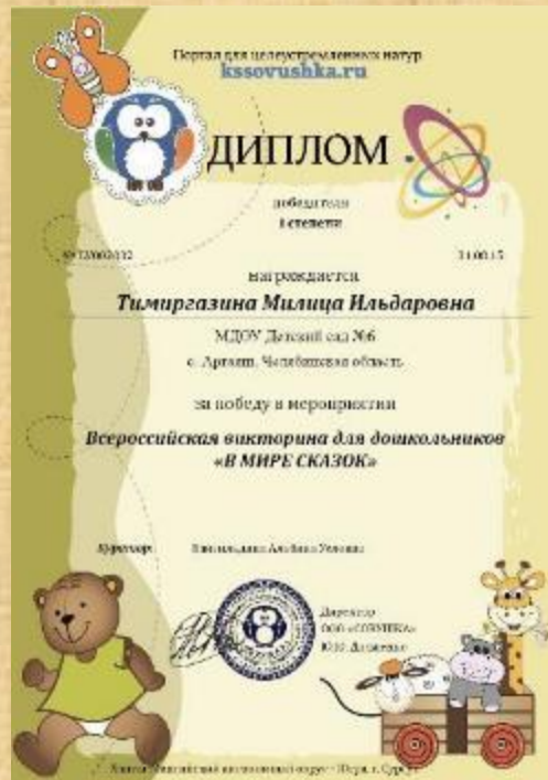
Диплом победителя всероссийской викторины для дошкольников «В мире сказок»