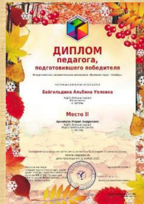
Диплом педагога, подготовившего победителя