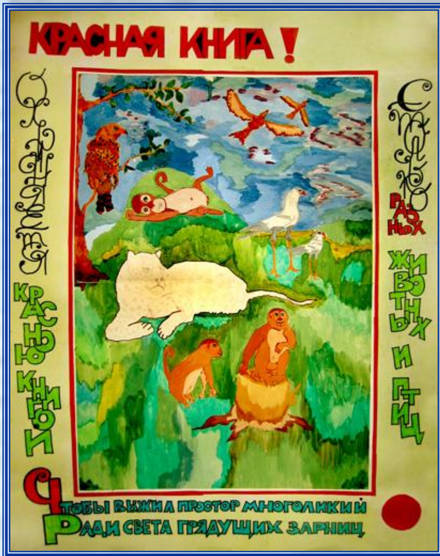
плакат «Красная книга»