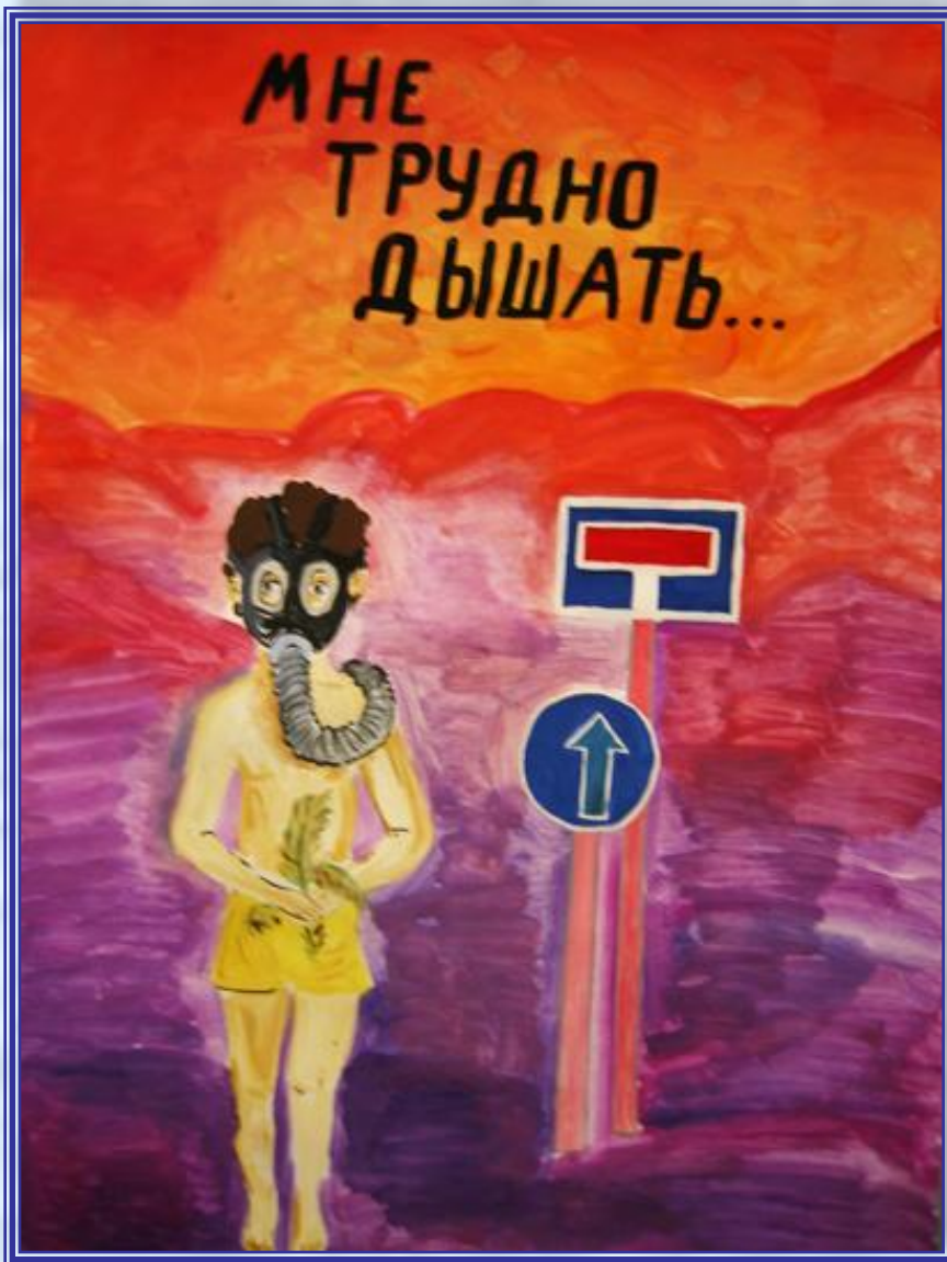
рисунок "Мне трудно дышать"