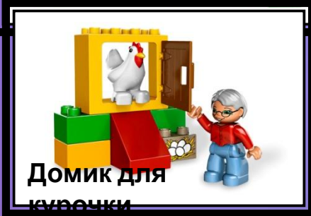
Домик для курочки