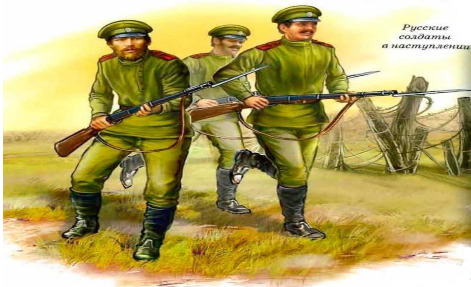
Русские солдаты в наступлении

тила упорное сопротивление в районе Киселин германских войск, переброшенных из Франции и с других участков фронта. 16 июня — 5 июля 8-я армия отражала контрудары германских армейских групп. 24 июня Юго-Западному фронту была передана 3-я армия из Западного фронта. Попытка форсирования реки Стоход и овладения Ковелем силами 3-й и 8-й армий окончилась неудачей, так как немцы перебросили сюда крупные силы и создали мощную оборону. В центре фронта 11-я армия в мае прорвала фронт у Сопанова, а 7-я армия — у Язловца, но контрударами противника наступление было приостановлено.