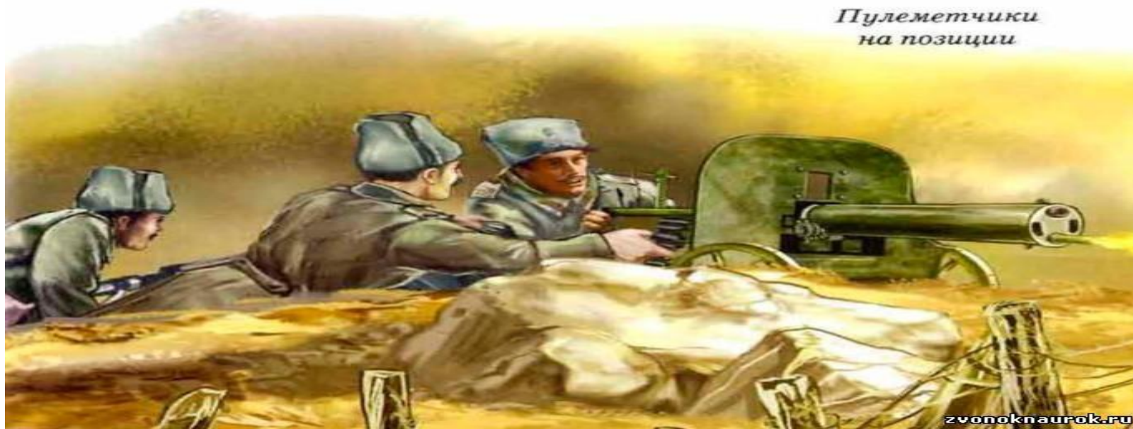
Пулеметчики на позиции

Наибольшего успеха достигла 8-я армия, наступавшая в направлении Луцка. Прорвав фронт на 16-километровом участке Носовичи — Корице, она 7 июня заняла Луцк, а к 15 июня разгромила 4-ю австро-венгерскую армию эрцгерцога Иосифа Фердинанда и продвинулась на 65 километров. Однако затем 8-я армия, исчерпавшая свои и фронтовые резервы, встре-