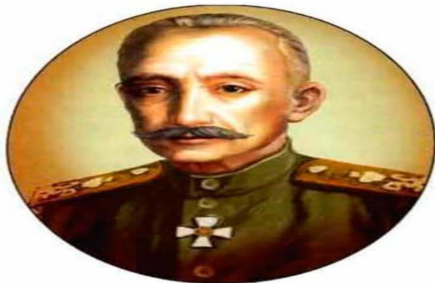
Генерал А. А. Брусилов

«сердечное соглашение» — союз Франции, Великобритании и России, а впоследствии и нескольких других государств, направленный против Германии и ее союзников во время Первой мировой войны), русское командование решило в середине июня 1916 начать крупное наступление на всех фронтах. Главный удар должны были нанести войска Западного фронта из района Молодечно в направлении на Вильно, а вспомогательные удары — Северный фронт из района Двинска — на юго-запад и Юго-Западный фронт из района Ровно — на Луцк. В мае союзники обратились к России с просьбой ускорить начало наступления. Русская армия решила начать наступление Юго-Западного фронта на две недели раньше намеченного срока. Русские решили, что Юго-Западный фронт нанесет несколько одновременных сильных ударов каждой армией (8-й, 11-й, 7-й и 9-й), чтобы сковать действия резервов противника. По этому плану главный удар должен был быть нанесен на правом крыле фронта войсками 8-й армии.