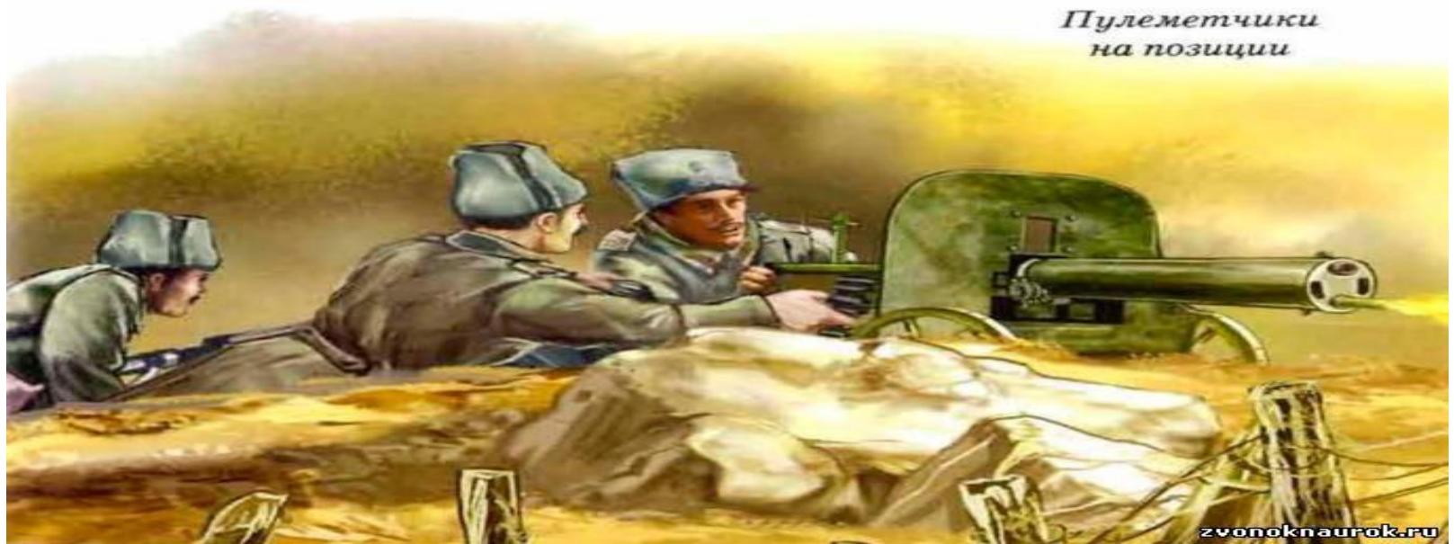
Пулеметчики на позиции

Наибольшего успеха достигла 8-я армия, наступавшая в направлении Луцка. Прорвав фронт на 16-километровом участке Носовичи — Корице, она 7 июня заняла Луцк, а к 15 июня разгромила 4-ю австро-венгерскую армию эрцгерцога Иосифа Фердинанда и продвинулась на 65 километров. Однако затем 8-я армия, исчерпавшая свои и фронтовые резервы, встре-