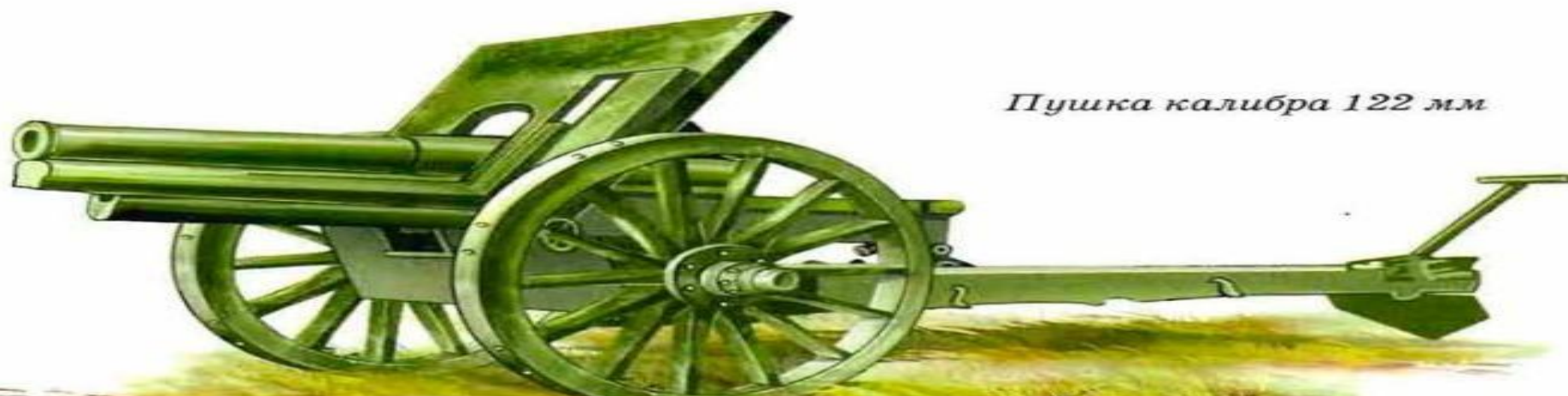
Пушка калибра 122 мм

Асами стали называть тех летчиков, которые в совершенстве овладели приемами воздушного боя и сбили не менее пяти самолетов. В Первую мировую войну таких результатов добились немногие пилоты. А самым результативным асом Первой мировой войны стал знаменитый Манфред фон Рихтхофен, сбивший 80 самолетов противника. Заметим, что в военной авиации того времени парашюты широкого распространения не получили, хотя в 1911 году русским изобретателем Г. Е. Котельниковым был создан прекрасный парашют почти современного вида, который можно было применять без всяких опасений. Но парашютами снабдили тогда лишь экипажи русских тяжелых бомбардировщиков «Илья Муромец» (да и то не все), а летчики-истребители вынуждены