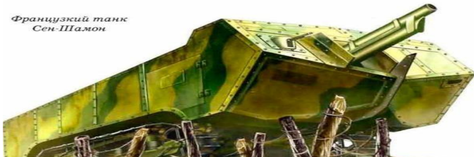
Французский танк Сен-Шамон

Вторая мировая война и Великая Отечественная война как ее составная часть остаются до сих пор до конца не разгаданными загадками истории. В последнее время появилось множество новых теорий, по-своему объясняющих поведение воевавших стран и их лидеров. Действительно, почему Гитлер вел себя