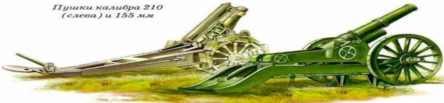
Пушки калибра 210 (слева) и 155 мм

Еще одной диковинкой Первой мировой войны стал танк. Он появился не случайно, а по крайней необходимости. Дело в том, что Первая мировая война была позиционной. Что это значит? А то, что по обе стороны линии фронта люди зарывались в глубокие окопы, окружали их различными укреплениями и сидели в них друг напротив друга (точнее, недруг напротив недруга) как суслики в норах. Кто читал прекрасную повесть Аркадия Гайдара «Школа», тот помнит, что писал с фронта отец главного героя: «Жив-здоров. Сидим в окопах. И сидеть конца края не предвидится...» Хождения в атаки были чистым самоубийством: прорвать фронт противника никто не мог. Пробовали для этой цели использовать отравляющие газы, но эффект был такой ужасающий, что от них отказались (даже Гитлер, терпя поражения четверть века спустя, не решился их использовать).