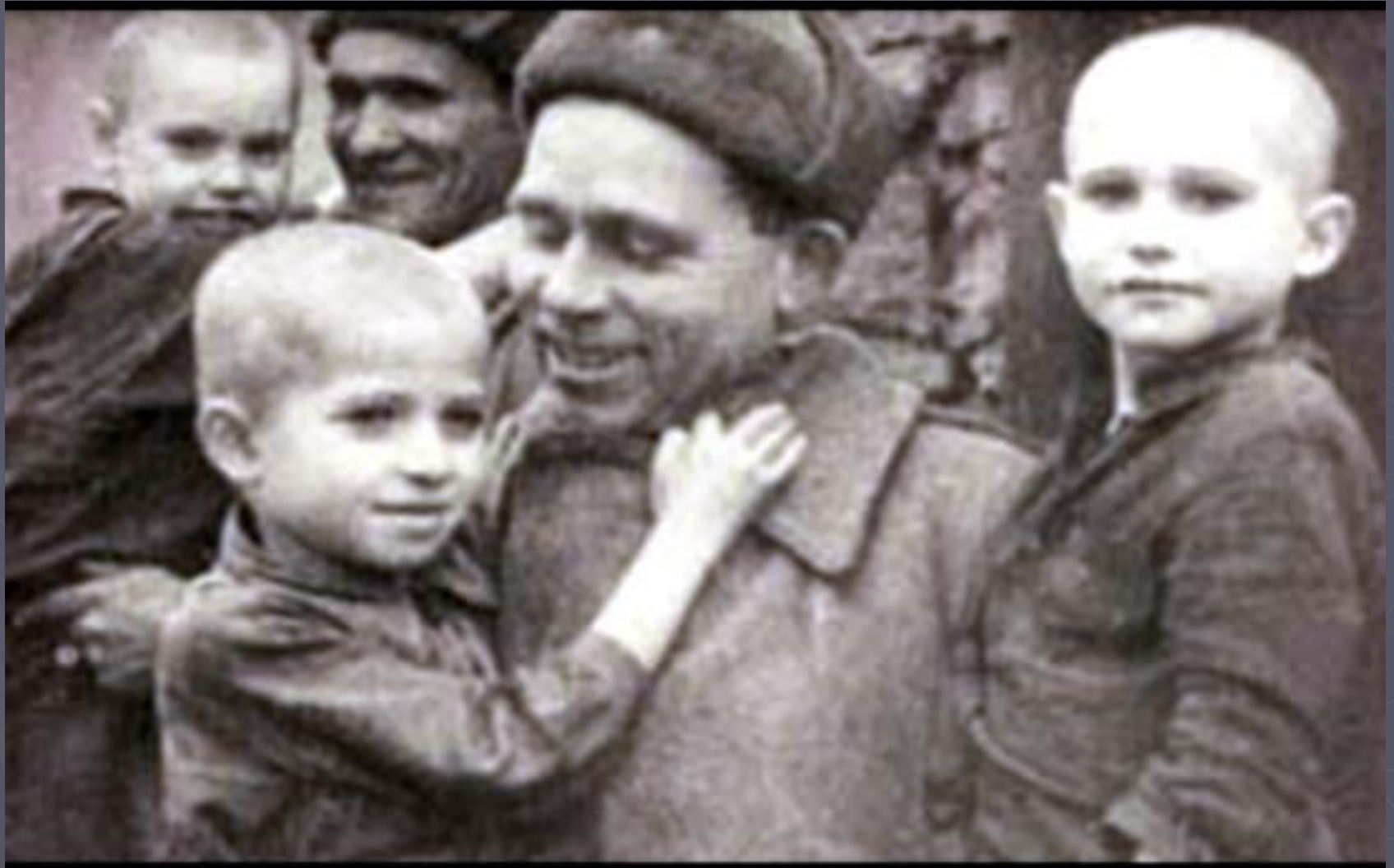
На фото: Освобожденные дети Саласпилса в 1944 г.

Замечая следы преступлений, фашисты ликвидировали лагерь в октябре 1944 г. Но свидетельства чудом выживших узников не люди уничтожить не смогли.